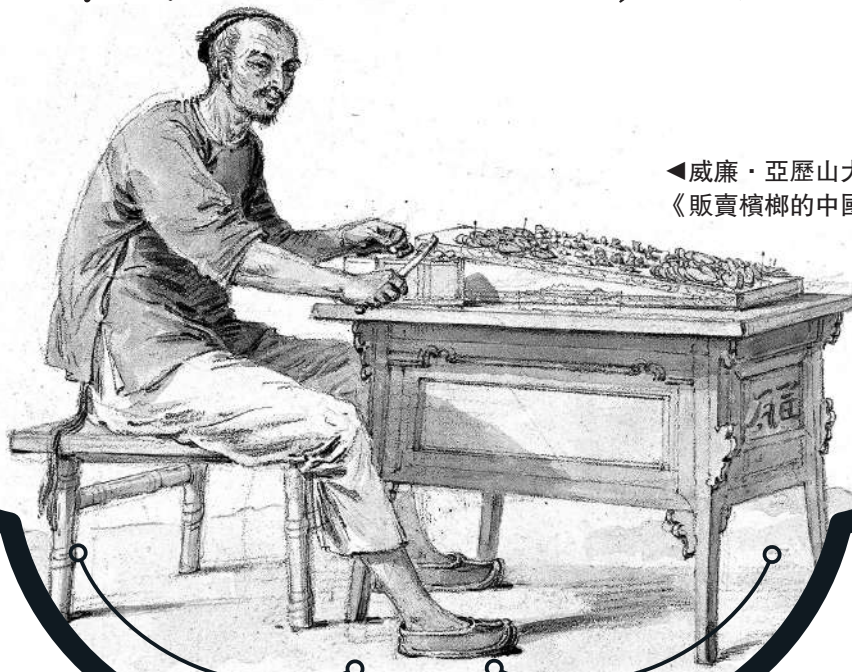
▲威廉·亞歷山大所作《販賣檳榔的中國人》。