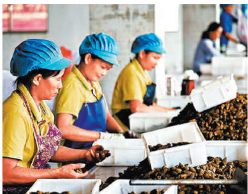
▲當下人們對健康越來越重視，對檳榔給身體帶來的危害也認識得更加充分，檳榔產業隨之受到限制和監管。

如書名所示，檳榔伴隨中國人已經兩千多年了。不過，檳榔其實並非中國土產，它原產於馬來半島或菲律賓群島，中文「檳榔」的發音就近似於馬來語的「pinang」。人類嚼食檳榔的歷史可以追溯到史前時代，目前最早的證據來自菲律賓巴拉望島的都揚洞，該地出土的人類牙齒上有明顯的檳榔染色痕跡，時間約在公元前2660年，當地還出土了盛有蚌灰的蚌殼，據此推測，大約當時人已經將檳榔和石灰一同嚼食了，而這與現在東南亞、南亞的吃法幾乎相同。公元前1世紀前後，在南亞地區，檳榔和其他香料混合咀嚼已成為人們維護口腔衛生的習慣。唐代玄奘在印度求學時，每日得到的「口糧」中就包括檳榔子二十顆，還有擔步羅葉也就是荳蔻一百二十枚，應該就是與檳榔一起咀嚼用的。