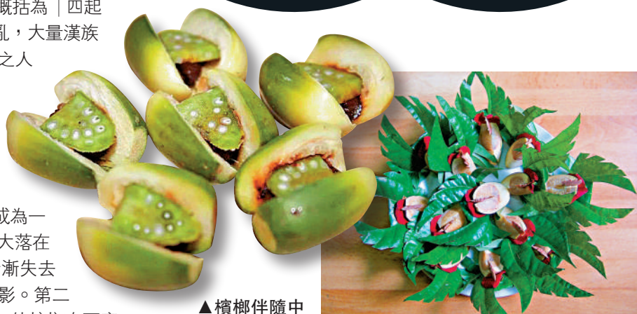
▲檳榔伴隨中國人已經兩千多年了。