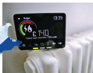
▲英國暖氣費用昂貴，恐有300萬戶家庭將陷入燃料貧困。