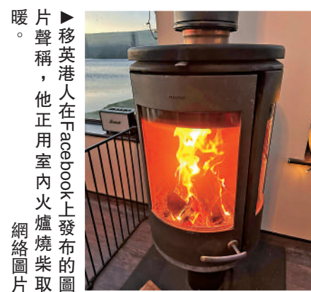
▲移英港人在Facebook上發布的圖片聲稱，他正用室內火爐燒柴取暖。

冬天一天的淨電費大約14-16磅（約138-158港元）。更有人表示，天氣特別冷的時候每天甚至都要二三十英鎊，「嚇死人」，也不知道是哪裏出了問題。除此之外，還有港人在帖文下分享哪種木材更好燒，燃燒時煙更小，有人說木材要風乾很久再燒，不然很難燒且煙很大。還有人也訴苦說：「晚上睡覺的時候都要看着火，如果沒注意火熄滅了，第二天就會被凍醒，水管也會結冰，還得拿吹風機用熱風去融化，不然水管就會爆裂。」