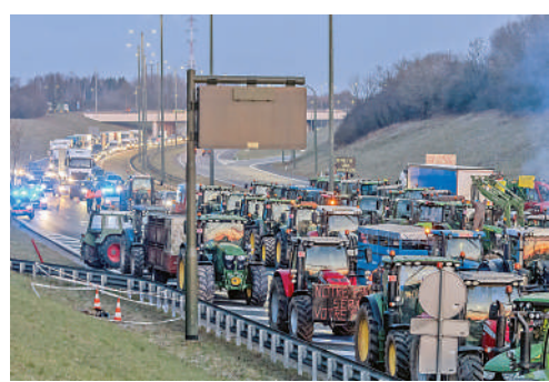
▲比利時農民29日將拖拉機開上公路，舉行抗議活動。

法國農業部長費諾則表示，法國希望本周內作出決定，以修改歐盟的「自然復育法」，協助國內的農民。歐洲議會去年通過歐盟「自然復育法」，以復原遭破壞的自然生態環