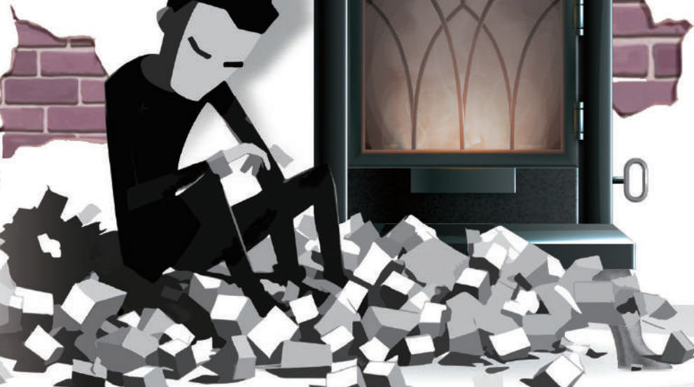
▲研究指英國眾多家庭生活陷入燃料貧困。圖為行人22日走在倫敦街頭。

冬天一天的淨電費大約14-16磅（約138-158港元）。更有人表示，天氣特別冷的時候每天甚至都要二三十英鎊，「嚇死人」，也不知道是哪裏出了問題。除此之外，還有港人在帖文下分享哪種木材更好燒，燃燒時煙更小，有人說木材要風乾很久再燒，不然很難燒且煙很大。還有人也訴苦說：「晚上睡覺的時候都要看着火，如果沒注意火熄滅了，第二天就會被凍醒，水管也會結冰，還得拿吹風機用熱風去融化，不然水管就會爆裂。」