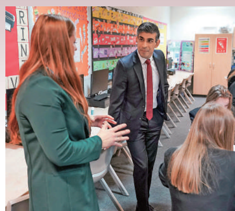
▲英國首相蘇納克29日訪問英格蘭東北部霍頓學院。

【大公報訊】據《衛報》報道：由於出生率下降、住房成本居高不下以及受英國脫歐和新冠疫情影响，居住在倫敦的兒童人數不斷減少，這影響了當地學校的招生工作，倫敦議會正準備關閉學校。