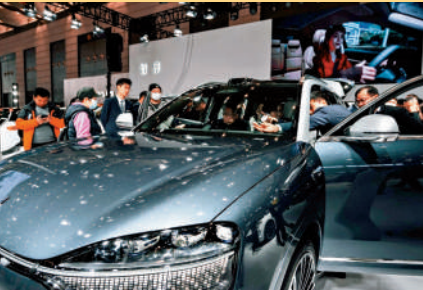
▲鴻蒙智行品牌亮相2024年第九屆元巨西安車展。

中國汽車工業協會近日發布的數據顯示，2023年中國汽車產銷量首次突破3000萬輛，雙雙創下歷史新高。具體來看，汽車產量達3016.1萬輛，