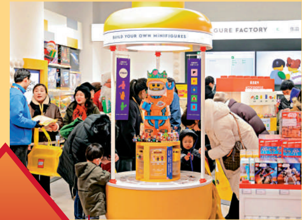
▲顧客在位於西安的樂高品牌店遊覽選購。