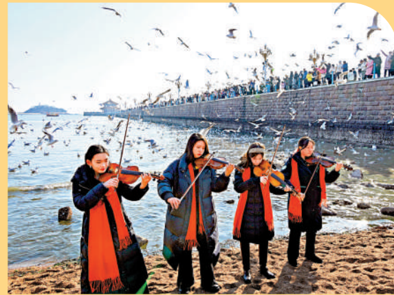
▲遊客在青島市市南區棧橋景區遊玩、賞鷗。新華社