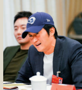
▲吳京當選新一屆中國影協副主席。

1月29日至30日，中國電影家協會第十一次全國代表大會在北京召開，馬浚偉首次成為中國電影家協會會員。他在參會間隙接受大公報記者採訪時表示，能夠加入中國電影家協會成為會員很榮幸很開心，在現場可以感覺到大會的隆重，雖然他過去的身份也許比較多，但電影是自己非常喜歡的一個表演藝術，「看到國家對電影業的重視和愛護，非常感動，希望未來可以多參與影協的工作，更了解我們國家電影業的發展趨勢。」