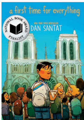
▲漫畫《A First Time For Everything》曾獲2023年美國國家圖書獎。