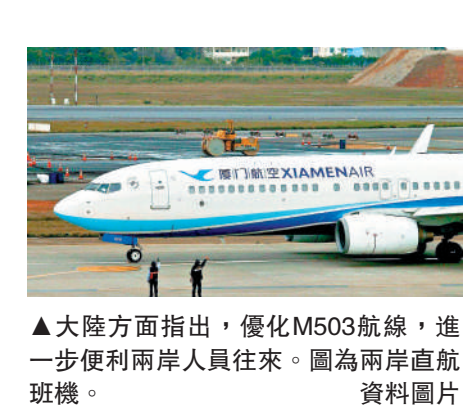
大陸方面指出，優化M503航線，進一步便利兩岸人員往來。圖為兩岸直航班機。資料圖片

【大公報訊】據新華社社報：民航局1月30日宣布取消M503航線自北向南飛行偏置和啟用M503航線W122、W123銜接航線由西向東運行。