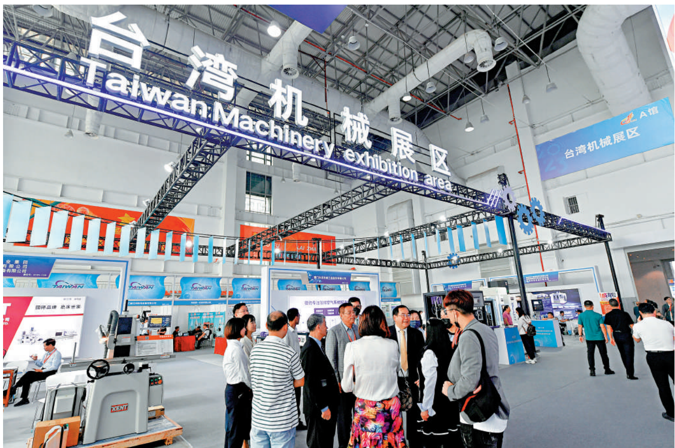
大陸是台灣地區最大的出口市場。圖為台灣機械業者赴大陸參展。