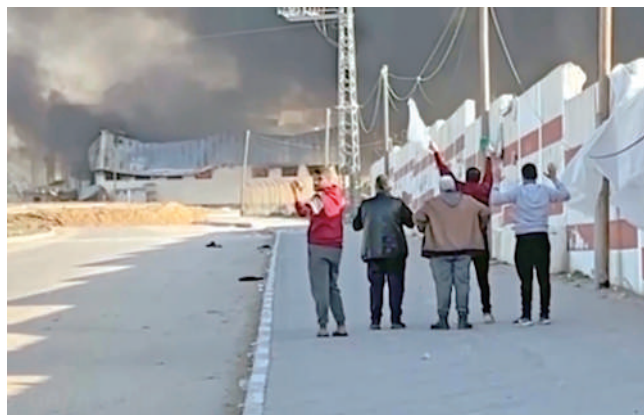
◀5名巴勒斯坦男子走在汗尤尼斯街頭，他們舉起雙手，其中有人揮舞着白旗。

以色列軍方1月30日發布新聞通報說，以軍在加沙地帶的軍事行動中，通過安裝泵和管道將大量海水引入地道，以迫使哈馬斯武裝人員現身。這是以軍首次正式承認在軍事行動中使用了水淹地道的方式。