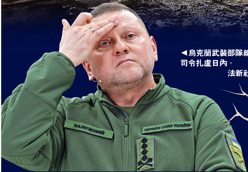
▶烏克蘭武裝部隊總司令扎盧日內。法新社