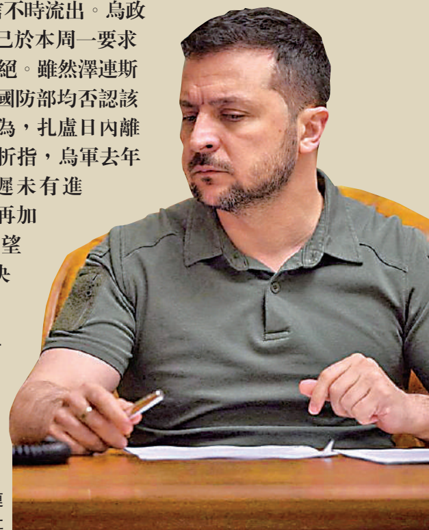
▶烏克蘭總統澤連斯基。

【大公報訊】綜合《華盛頓郵報》、《衛報》報道：近幾個月來，烏克蘭總統澤連斯基和烏武裝部隊總司令扎盧日內不和的傳言不時流出。烏政府高級官員透露，澤連斯基已於本周一要求扎盧日內下台，但遭其拒絕。雖然澤連斯基的發言人和烏克蘭國防部均否認該消息，但輿論普遍認為，扎盧日內離職只是時間問題。分析指，烏軍去年夏天開始的反攻遲遲未有進展，美歐援烏疲勞，再加上扎盧日內在國內民望高企，令澤連斯基決心將其免職。