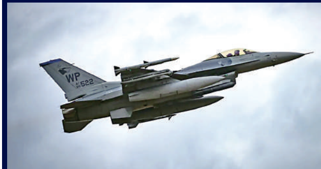
◀一架F-16戰機17日在駐韓美軍群山空軍基地起飛。