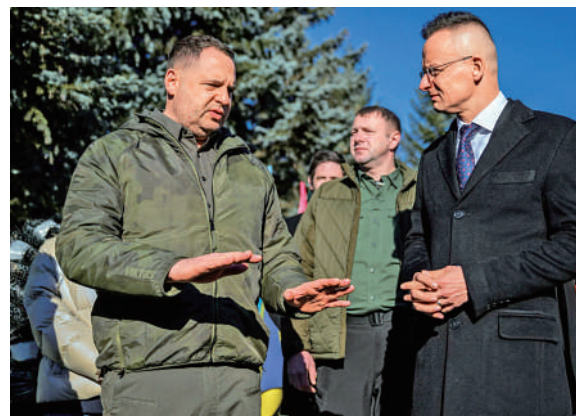
◀烏克蘭總統辦公室主任葉爾馬克1月29日與來訪的匈牙利外長西雅爾多（右）會晤。

此前回應稱：「歐洲人和美國人都很清楚（烏克蘭）的腐敗程度，他們知道有相當一部分資金被偷走了。這筆資金無法改變戰場進程，只會對陷入困難的歐盟經濟造成損害。」