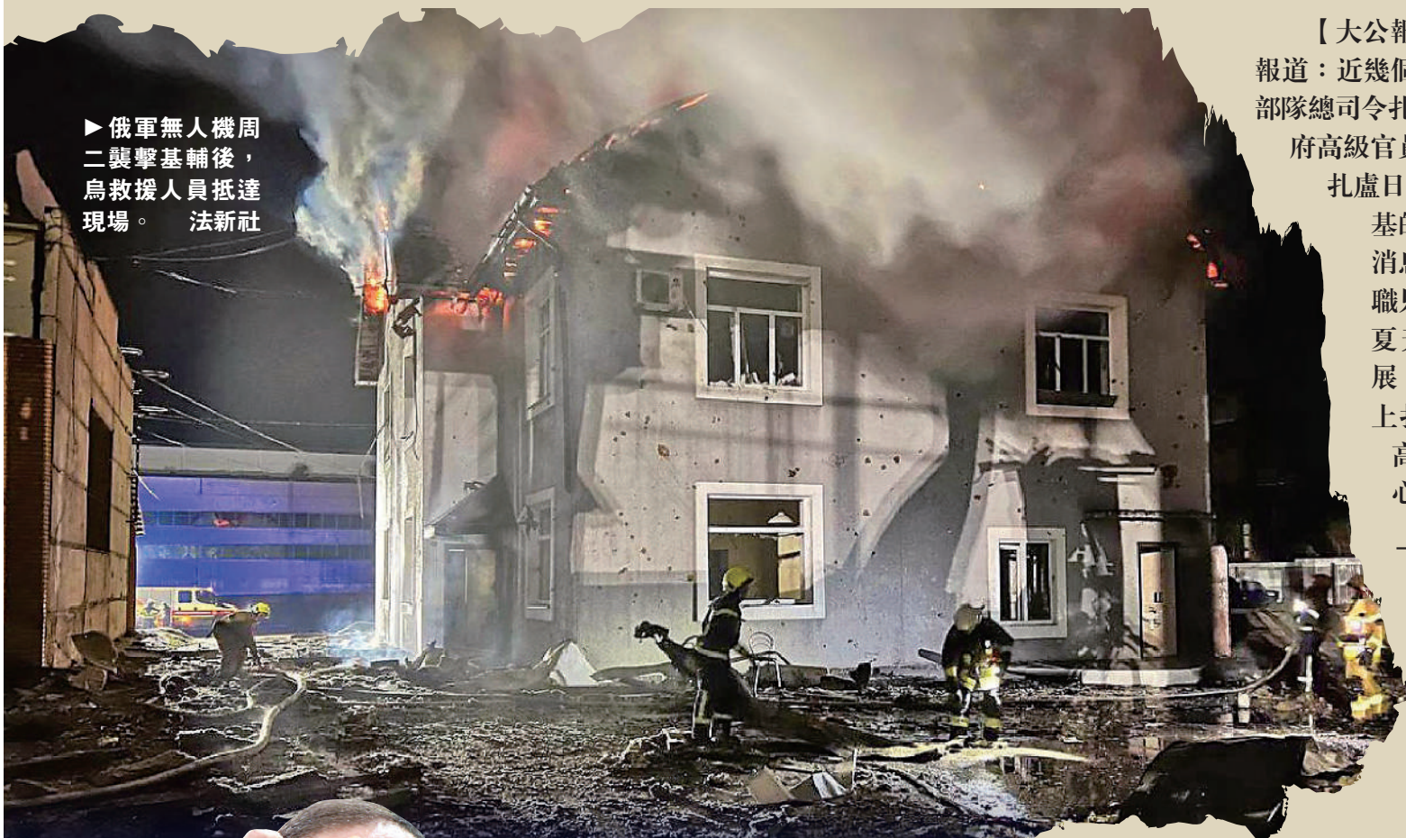
▶俄軍無人機周二襲擊基輔後，烏救援人員抵達現場。

【大公報訊】綜合《華盛頓郵報》、《衛報》報道：近幾個月來，烏克蘭總統澤連斯基和烏武裝部隊總司令扎盧日內不和的傳言不時流出。烏政府高級官員透露，澤連斯基已於本周一要求扎盧日內下台，但遭其拒絕。雖然澤連斯基的發言人和烏克蘭國防部均否認該消息，但輿論普遍認為，扎盧日內離職只是時間問題。分析指，烏軍去年夏天開始的反攻遲遲未有進展，美歐援烏疲勞，再加上扎盧日內在國內民望高企，令澤連斯基決心將其免職。