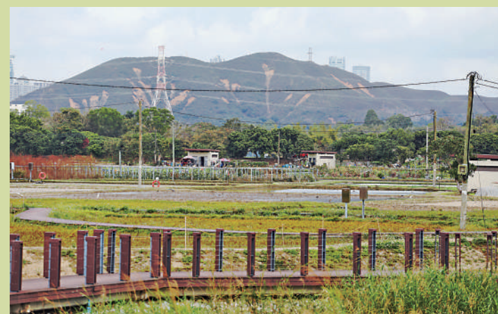
▲塋原自然生態公園預計在下半年向公眾開放。

新田科技城範圍內現時有約126公頃棕地，例如露天倉庫、工場等，以及9個禽畜飼養場，預計未來將會發展多層現代產業大廈，並清拆飼養場，更好地利用土地資源。同時未來將保留現有鄉村區域，保護鄉村內所有法定古蹟和已獲評級歷史建築，包括大夫第、麟峯文公祠及東山古廟等，並維護通往鄉村的通風廊，納入景觀走廊。