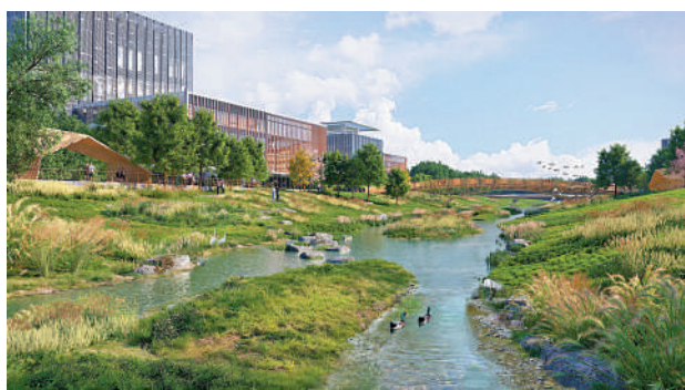
▲西排水道將改建為景觀河道，提供多元化親水體驗。

新田科技城北部部分區域為濕地保育區，將建立一條300米寬度的候鳥飛行走廊，設有建築物發展高度限制，沿路70米寬範圍將設為非建築用地，鄰近濕地保育區35米寬的非建築用地亦將用作景觀緩衝區。區內將保留拉姆薩爾濕地、米埔隴村及米埔村的鷺鳥林、現有的野生動物走廊及彭龍地的成熟林地等，達至城鄉與自然環境共融。