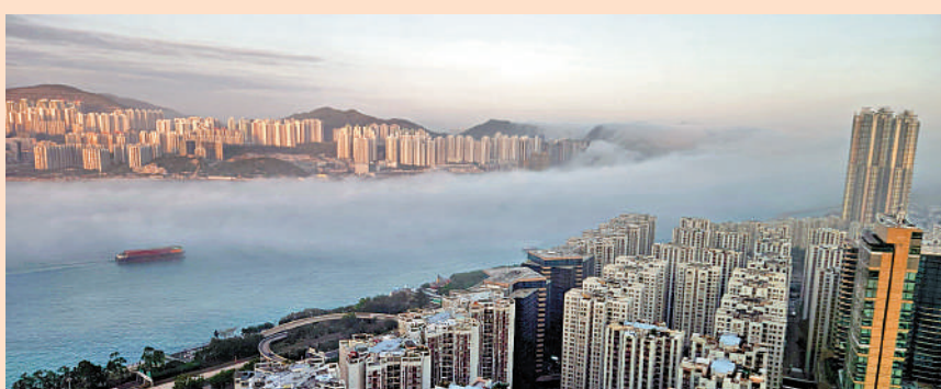
▲網民拍下雲霧低纏維港的美景。

深偽技術並非防不勝防，協調中心指出，只要在視像對話時遮掩部分面容，便有機會暴露對方的真實面貌，市民若有懷疑也可要求對方做出不同可以遮掩面容的動作，若騙徒假冒親友索取金錢，市民也應從不同途徑向親友核實。