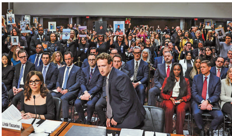
◀ 朱克伯格向受害者家屬道歉後，轉身坐下。

社交媒體行業分析師納瓦拉認為，這次聽證會和其他同類聽證會沒什麼區別，有着「很多嘩眾取寵場面」，朱克伯格的道歉是他「完美的拍照機會」。