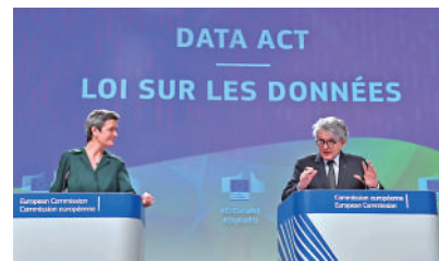
▲ 歐盟負責制定數碼監管法律的主要官員進行討論。

● 歐盟《數碼服務法》去年8月25日起實施，要求谷歌、Meta和蘋果公司等科企巨頭，在收到個別使用者通知或國家機構告知後，迅速移除根據歐盟及歐盟成員國法規所訂的非法內容，包括有害兒童青少年資訊、不實資訊、仇恨言論、強迫推銷等網絡內容。