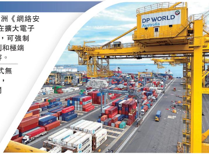
◀ 迪拜環球港務集團澳洲公司網絡遭黑客攻擊，旗下四大港口陷入癱瘓。