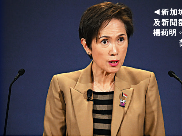
◀新加坡通訊及新聞部部長楊莉明。

【大公報訊】綜合《聯合早報》、《海峽時報》報道：新加坡《網絡犯罪危害法》2月1日起正式生效。根據該法，新加坡當局有權按照個別案件情況，發出5種指令，包括停止通訊、內容屏蔽、用戶限制、網域屏蔽及刪除手機應用，不遵從指令者可能被起訴。當局表示，該法將幫助政府更有效打擊網絡犯罪活動，主要針對危害國家安全、煽動暴力、破壞民族和諧，以及詐騙等行爲。