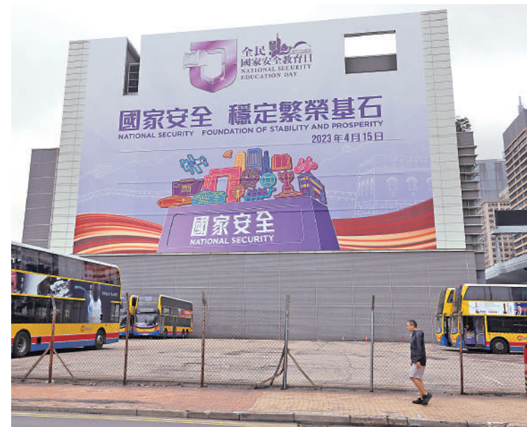
▲基本法23條立法只針對極少數危害國家安全分子，維護的是700多萬市民的合法權益。