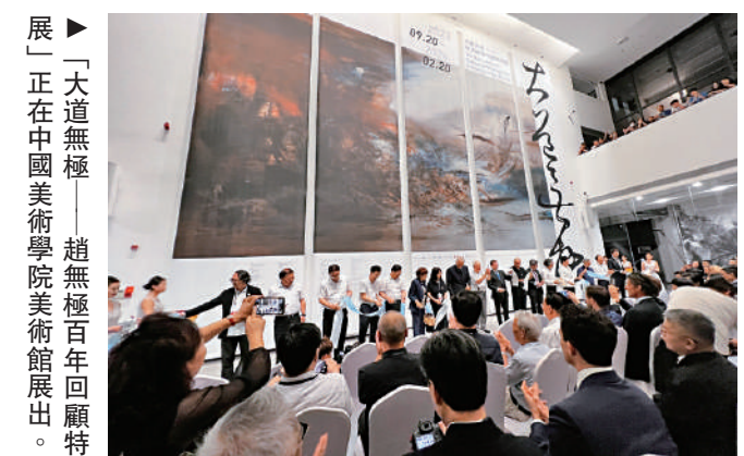
▲「大道無極——趙無極百年回顧特展」正在中國美術學院美術館展出。