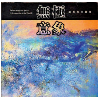
▲1996年趙無極的大型回顧展「無極意象」在香港藝術館舉行。

館舉辦「趙無極教授油畫展」。多年後，趙無極的大型回顧展「無極意象」於1996年在香港藝術館舉行。