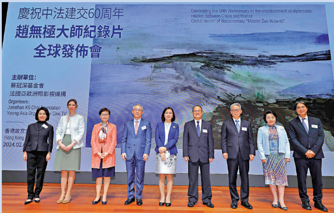
▲主禮嘉賓出席「慶祝中法建交60周年暨趙無極大師紀錄片全球發布會」。