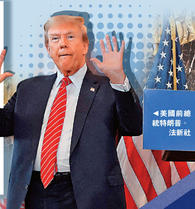
▲美國前總統特朗普。