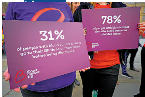
▲英國預算緊縮影響國民癌症治療。圖為癌症慈善機構代表1月31日在倫敦呼籲恢復癌症專項計劃。