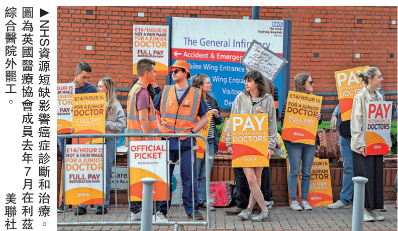
圖為英國醫療協會成員去年7月在利茲綜合醫院外罷工。

在癌症存活率差的情況下，英國的癌症藥物短缺更是雪上加霜。因為政府限制支出、英國脫歐、英鎊購買能力下降、生產困難等綜合因素，截至去年12月18日，英國短缺的藥物種類達到96種，隨後又增加至106種，幾乎是2022年1月的52種的兩倍多。包括治療癌症、精神分裂症、糖尿病二型和癲癇等疾病的藥物都供不應求。英國社區藥房去年一項最新壓力調查發現，92%的藥房每天都在處理藥品供應短缺問題，87%的藥房成員認為患者的健康正面臨風險，且認為NHS在藥物供應的投資不足。