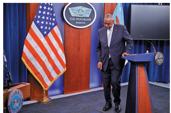
▲美國國防部長奧斯汀2月1日在五角大樓出席新聞發布會，他術後仍受腿疼困擾。

在美國面臨中東危機不斷升級之際，身為國防部長的奧斯汀突然「失蹤」，受到了美國各界的嚴厲批評。多名共和黨議員呼籲奧斯汀下台，但拜登僅對奧斯汀的「判斷失誤」表示遺憾，並表示他仍對防長「充滿信心」。