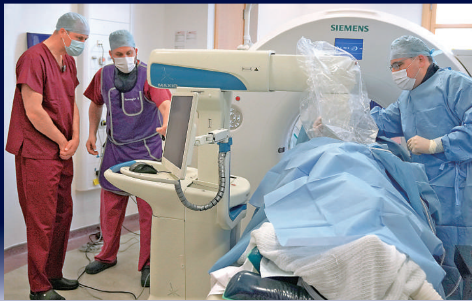
▲英國癌症存活率提升速度顯著放緩。圖為英國威廉王子（左）2022年5月在倫敦視察皇家馬斯登醫院。