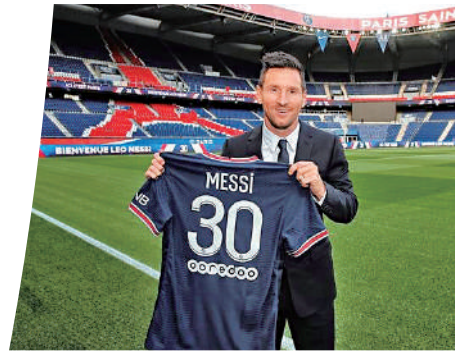
▲美斯離開巴塞後便加盟巴黎聖日耳門。