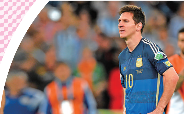
▲美斯在2014年世盃決賽負德國隊僅獲亞軍。