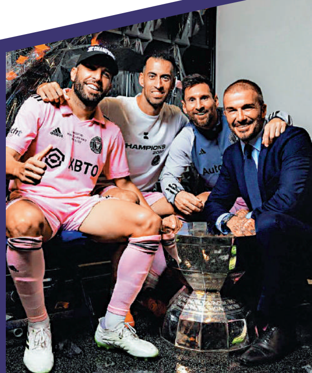
▲碧咸（右一）是美斯（右二）加盟邁亞密的重要助力。

不過，碧咸的任務還未完成，美斯的合約明年屆滿，相信碧咸會爭取他續約，甚至在球隊踢至掛靴，為邁亞密歷史留名。