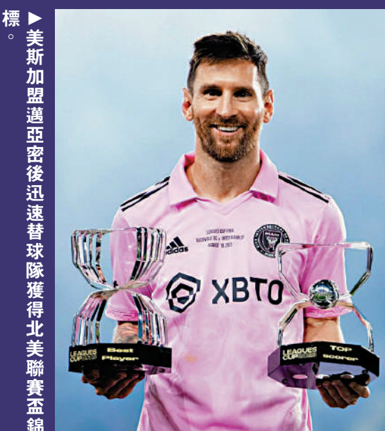
▲美斯加盟邁亞密後迅速替球隊獲得北美聯盃錦標。