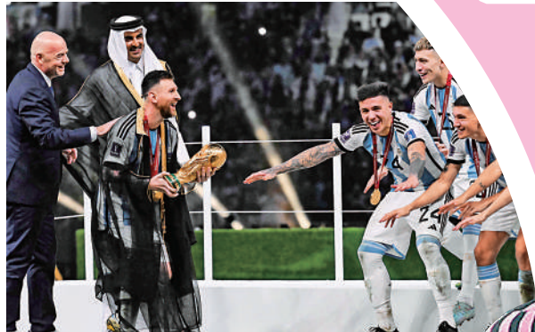
▲美斯（左三）領阿根廷在2022年世盃奪得冠軍。