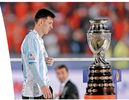
▲美斯在2015年美洲盃決賽互射12碼不敵智利屈居亞軍。