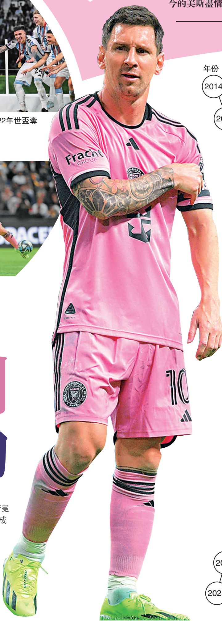
▲美斯訪港掀起熱潮。

去年美斯約滿巴黎聖日耳門，一度很接近重返巴塞，但結果接受了邁亞密老闆之一碧咸的邀請加盟。留在歐洲，美斯可繼續在最頂尖的賽事競逐、繼續吸盡鎂光燈，但他卻選擇走到重要性遠遠較低的美職，為當地足球發展出一分力，而在上月的「FIFA最佳」頒獎禮上，再破紀錄第8次成為世足先生的美斯，更加首次在自己當選的一屆缺席，寧願專心跟隨球隊操練備戰新球季，可見美斯已完全過了10年前依然介懷勝負、爭名逐利的階段，如今已昇華至享受踢球的心境，相信今天球迷亦會見到一個踢快樂足球、為這項全世界最受歡迎運動貢獻餘熱的美斯。