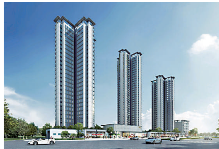
遠洋天成由多幢物業組成，樓高介乎27至34層，共500伙，預計今年6月竣工。

另一個是82平米單位，同為三房兩廳設計，這個面積段含贈送面積，實用率達94%。單位四開間朝南設計，三個房間望山景，主人套房利用了北向窗台的空間，可以打造衣櫃位，空間感比較突出。