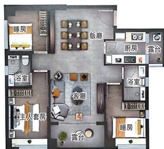
建鑫·荔棠雅苑93平米三房兩廳戶型圖。