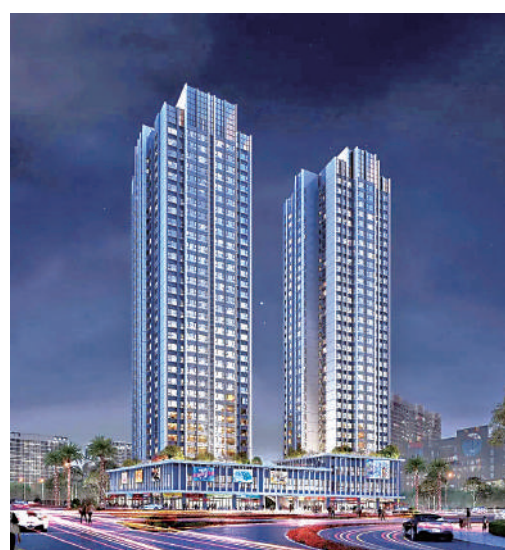
建鑫·荔棠雅苑由兩座物業組成。