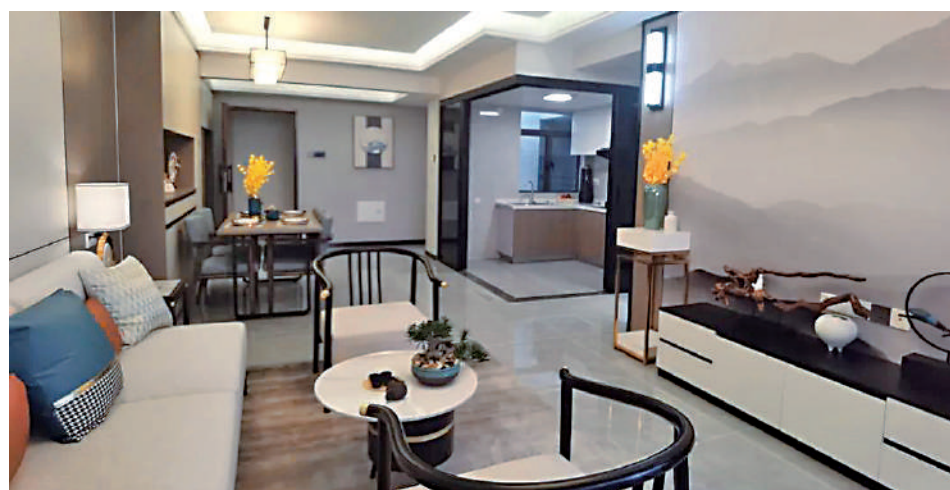
建鑫·荔棠雅苑間隔多元化，半開放式廚房設計，擴大室內空間感。