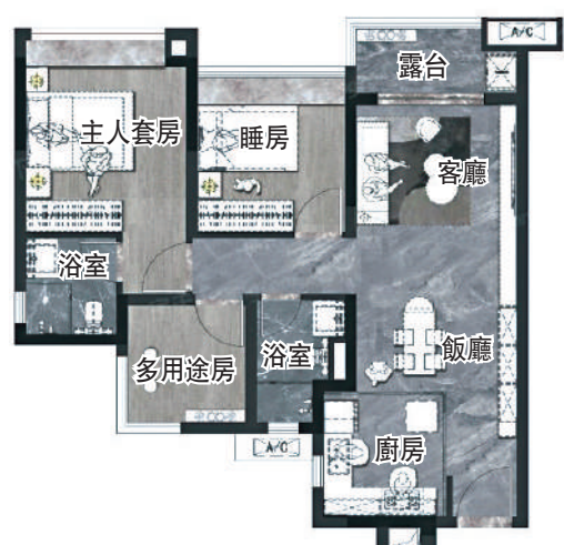
路勁星棠78平米三房兩廳戶型圖。