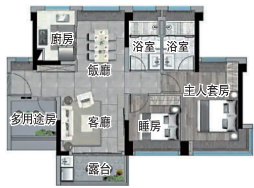
遠洋天成82平米三房兩廳戶型圖。