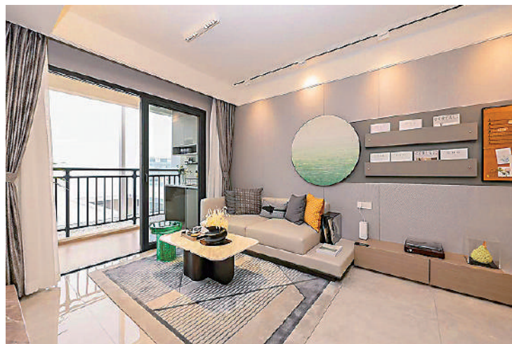
遠洋天成以高實用率為賣點，單位通風及採光良好。

銷售人員表示，以高實用率作賣點的遠洋天成，提供530伙，每平米均價1.65萬元。熱門戶型包括69平米單位，三房兩廳間隔，南向設計，擁有較高的採光和通風效果，房間巧妙地利用窗台空間，使得實際使用率高達94%。