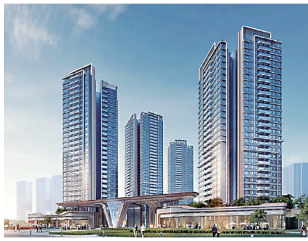
路勁星棠樓宇採用點式分布，單位無遮擋。