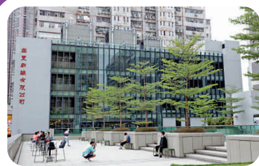
▲紗廠公園位於天台，環境清幽。