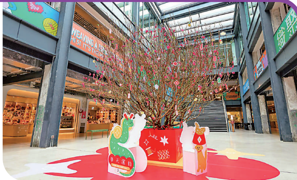
▲新春將至，南豐紗廠打造「抱抱龍」桃花樹。