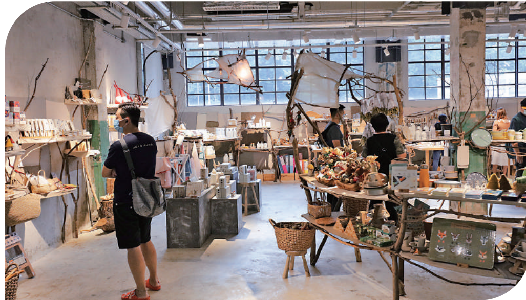
▲南豐紗廠開設了不少文創店舖。