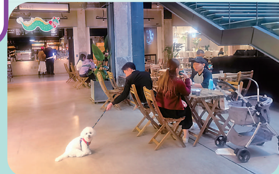
▲南豐紗廠歡迎人們帶寵物同行。

荃灣汀九可看迷人海景，特別還有適合觀景的觀景平台，遠望汀九橋，還能感受落日餘暉的美麗。海邊的汀九村，依山傍水，遊人沿着階梯一路向下，來到沙灘上，可見海豚雕塑，村內尚有前人生活遺存痕跡，行走其中，別有一番風味。