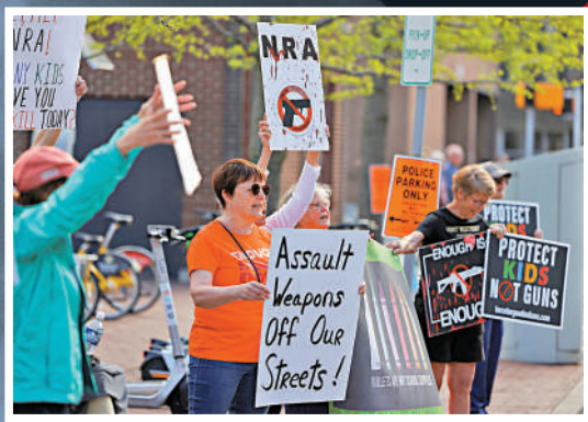
◀美國民眾去年4月在NRA年會場外示威。