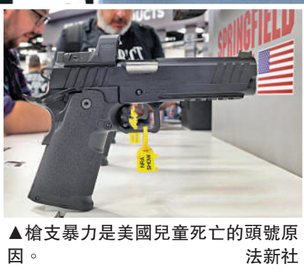
▲槍支暴力是美國兒童死亡的頭號原因。