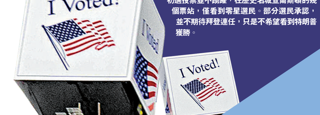
▲美國總統拜登（前）3日在特拉華州發表講話。