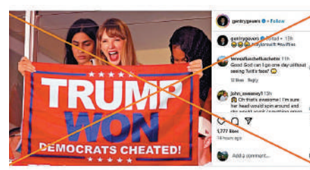
▲AI生成的圖片顯示Taylor Swift手舉支持特朗普的標語。