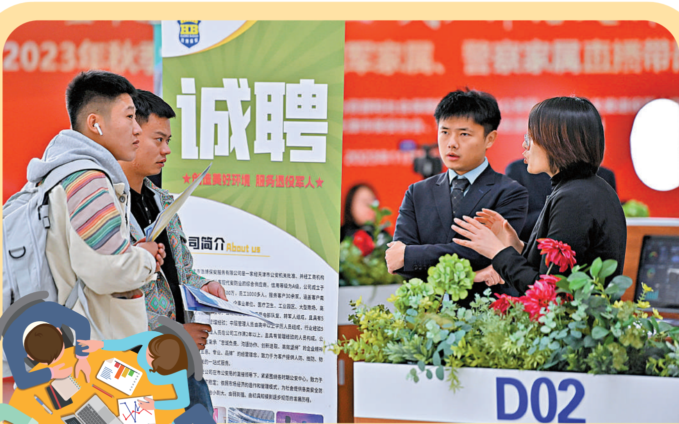
▲去年11月，天津一場招聘活動上，求職者正在尋找崗位。