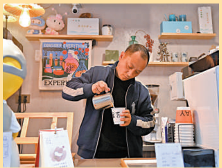
▲人社部將推出多種措施為創業減負。圖為浙江湖州一間民宿的咖啡館內，創業者正在製作咖啡。新華社

新職業亦將帶給畢業生更廣泛的就業機會。智聯招聘集團執行副總裁表示，近年新興職業招聘規模逐漸上升，社會發展催生了很多線下服務、娛樂領域的新興職業，例如寵物領域的遛狗師、寵物殯葬師、露營策劃師、劇本殺、貓咖等。隨着數字經濟的發展，企業數字化轉型將更加深入，更多數字技術新職業將不斷湧現，例如數字化解決方案設計師、數字學生應用技術員、人工智能訓練師等。不斷湧現的新職業將為青年畢業生就業、創業帶來更多元化的選擇。