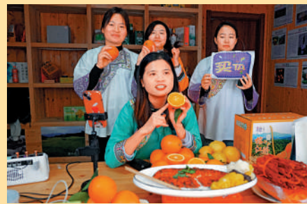
▲1月23日，貴州某鄉村直播培訓班學員正在進行直播實操培訓。

前陣子剛參加完2024年全國碩士研究生統一招生考試的張同學，已經馬不停蹄地趕到北京的一家互聯網大廠報到實習。「在準備考研期間，我也一直在投遞簡歷，希望能找一份高質量的實習，也算是得償所願了。」開心之餘，張同學表示，這段時間還是蠻疲憊的，實習的同時還要準備畢業論文，同時擔心着考研成績，「我現在屬於是左手抓，希望這段時間的辛苦最終能換得一個好結果吧。」他笑稱。