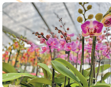
一盆較好的蘭花，應是有五、六朵已開花，而枝幹還有很多未開的花蕾。