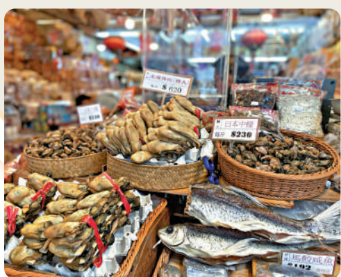
準備團年飯，名貴海味食材少不了。