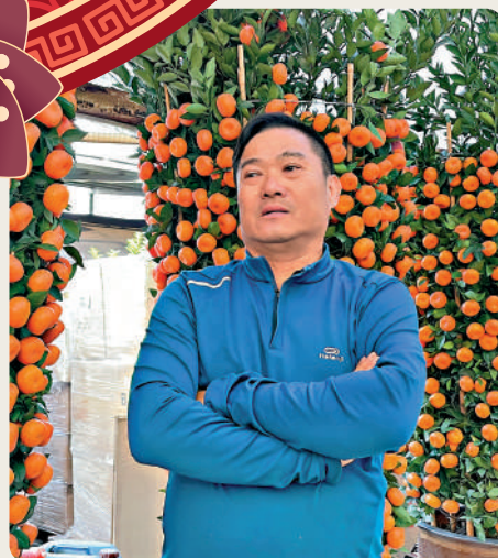
強哥指挑選年桔，要留意葉子是否翠綠及堅挺。

憑着多年務農經驗，強哥對植物已有獨特的心得，提醒淋花不宜重手，適量就夠。他更比喻一盆花有如人的腳部，鞋等於花盆，襪有如泥土，根便是腳趾，太多水浸着會令腳趾不舒服，太乾又會乾燥及痕癢，因此剛好的水分才最合適。