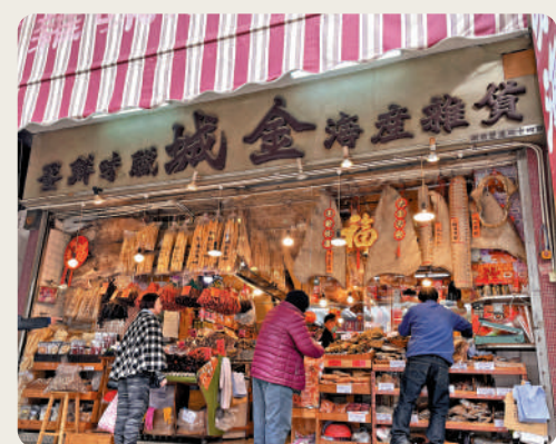
不少家庭想團年飯「食餐好」，到參茸海味店選購食材。

膠，近年金蠔和臘味都是送禮新品。金蠔更是時令食品所以好搶手！」熟知行情的林先生又指，如顧客購買海味自用，一般更會講究意頭，例如購買髮菜及金蠔，烹煮代表好意頭的發財好市，便會伴隨加入元貝、冬菇、花膠，甚至鮑魚、乾鮑或罐頭鮑等，令餸菜更美味。他還提醒，挑選海味要注意海味鮮明度，不要凹凸不平，整體看上去色澤分明，更明言：「往老字號舖頭購買容易找到好貨！」