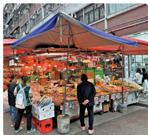
在花園街開檔多年的「強記生果」，每逢農曆新年都會轉售賀年糖果。

的市民大多會跟隨習俗，年三十便準備好全盒，並在全盒頂處放上一封利是和一對大桔，當大年初一有客人前來拜年時，便捧出全盒讓客人揀選食品；思想較新派的會用一個盒，將不同糖果放在一起，取其好意頭。她又補充，相信有大批市民會趁假期外遊，預計生意一般，但她希望農曆新年的習俗和文化可流傳下去。