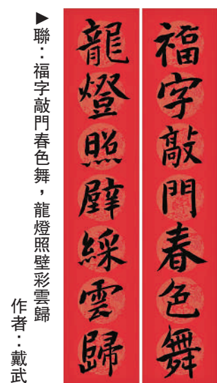
聯：福字敲門春色舞，龍燈照壁彩雲歸 作者：戴武