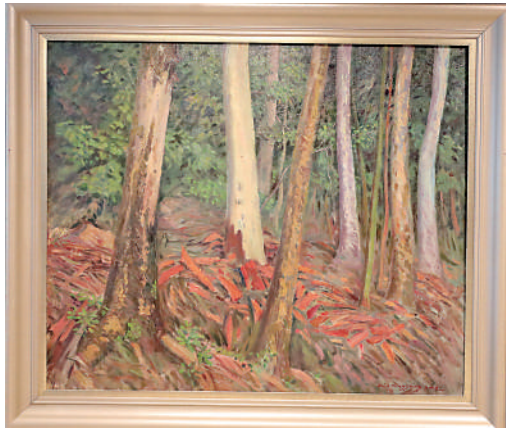
▲林鳴崗作品《生命之樹》(九)。