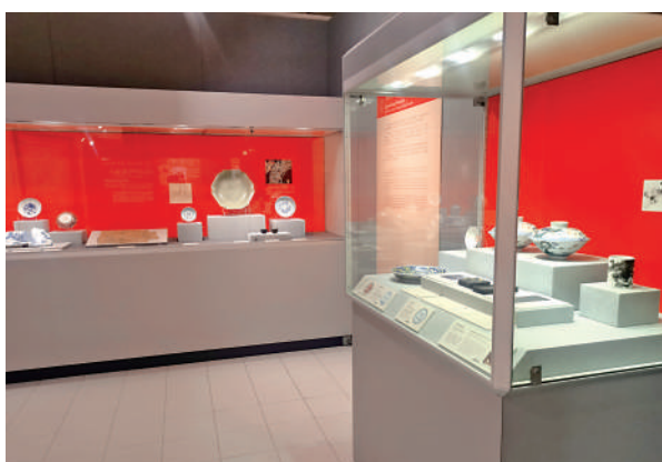
▲「甲辰說龍」展覽現場。

是次展覽展出文物跨越多個朝代，上至新石器時代至商周，下至明清兩朝至近現代，展品類別涵蓋玉石、甲骨、金銅、陶瓷、石刻、絲織、文房、拓本等，包括設計文物館徽時參考的