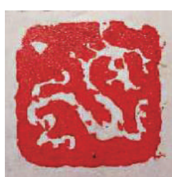
▲肖形印：龍 作者：王泉勝