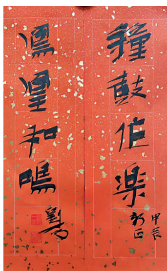
聯：鐘鼓作樂，鳳凰和鳴 作者：劉一聞