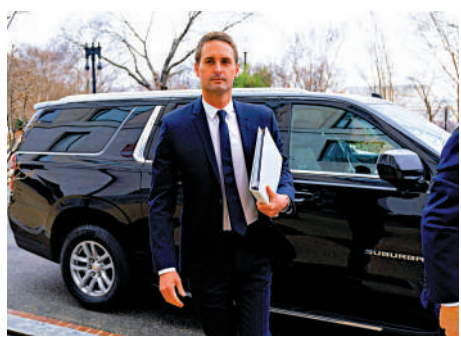
▲社交媒體巨頭Snapchat母公司Snap於5日宣布將裁員約540人。圖為Snap行政總裁斯皮格爾。

Layoffs.fyi創始人羅傑·李表示，「鑒於高利率環境以及科技行業低迷的持續時間，均超過最初的預期，科技公司仍在努力修正疫情期間的過度招聘情況」。羅傑·李說，近年主要有兩波裁員潮，一波是2020年第一季度到第二季度的疫情初