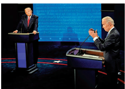
▲特朗普（左）和拜登於2020年10月22日在田納西州參加辯論。

在2020年美國大選中，特朗普和拜登曾進行兩次總統候選人辯論，另有一場辯論在特朗普被檢測出新冠陽性並拒絕參加線上辯論後被取消。另外，特朗普5日在採訪中還批評拜登連續第二年拒絕接受超級碗的電視轉播採訪，「他做不到，因為他不會說話」。