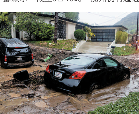
▲美國加州5日迎來強風暴，一輛汽車被泥石流困住。