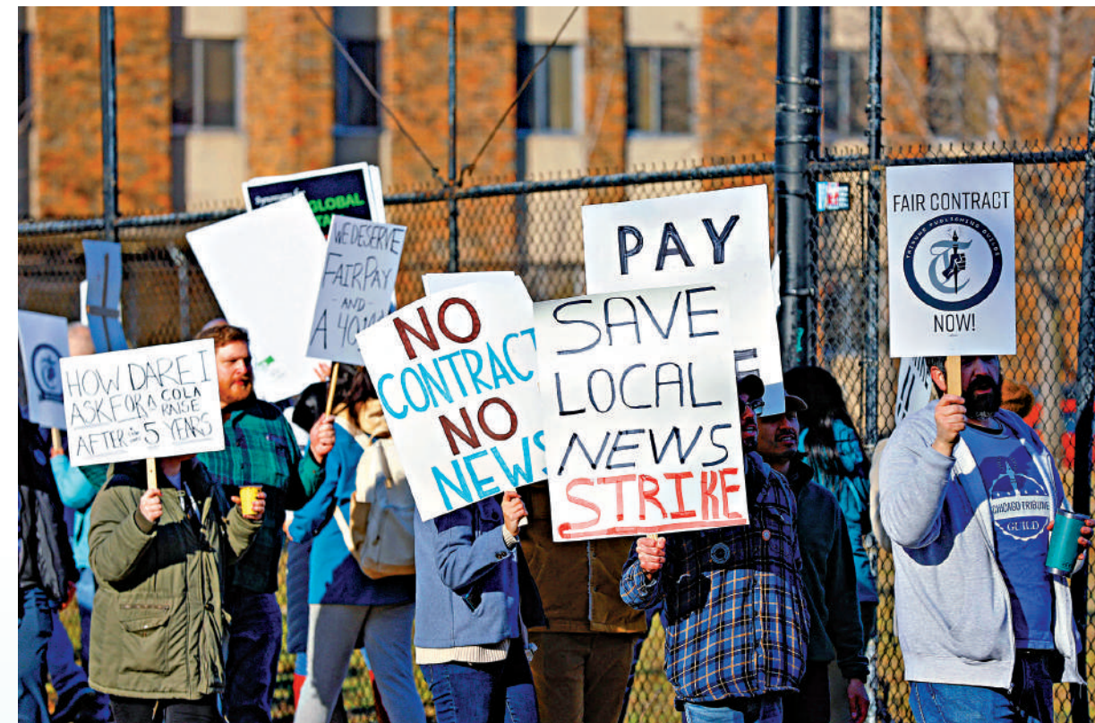
▲美國《芝加哥論壇報》工會成員不滿薪酬和裁員，1日發動罷工。

布，由於亞太市場業績下滑，啟動削減成本的計劃，將裁員3%至5%的員工，多達約3100人飯碗恐不保。加州最大的報紙《洛杉磯時報》1月23日宣布，由於持續虧損，該報將裁員至少115人，約佔員工總數的四分之一。芝加哥最大主流媒體《芝加哥論壇報》逾200人1日展開大罷工，抗議持續削減開支和不斷裁員。