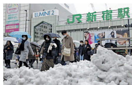
▲日本民眾6日在東京新宿站前走過，街道有厚厚的積雪。

縣前橋市錄得最高降雪量達11厘米，東京市中心和埼玉降雪量為8厘米。大雪還影響了交通，東日本鐵路（JR）中央