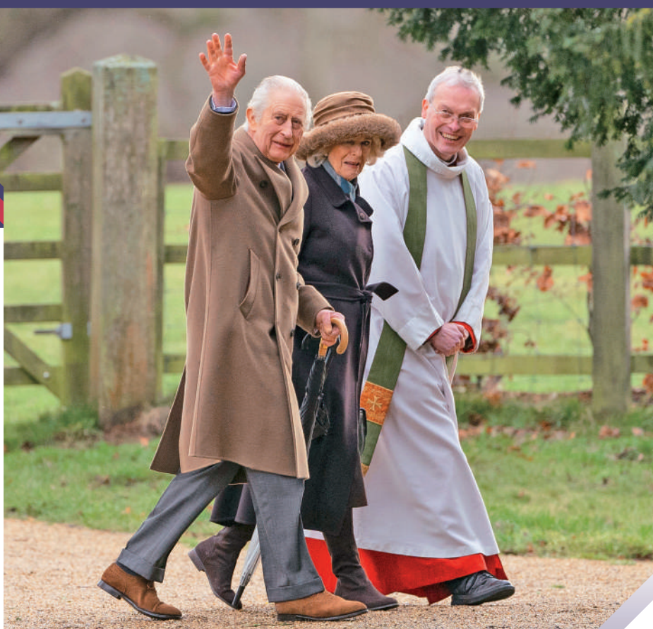
查爾斯三世（左）和王后卡米拉（中）4日到一間教堂做禮拜。

英國歷史上有4名君主退位，原因各不相同。最近一次發生在1936年，愛德華八世執意迎娶離過婚的美國女子辛普森，被認為在政治和宗教層面均不可接受，因此在位不滿一年便退位，其弟繼位成為喬治六世國王（即伊麗莎白二世的父親）。特沃米表示，若查爾斯退位，將面臨一系列憲法問題，王室料將盡量避免這一選項。