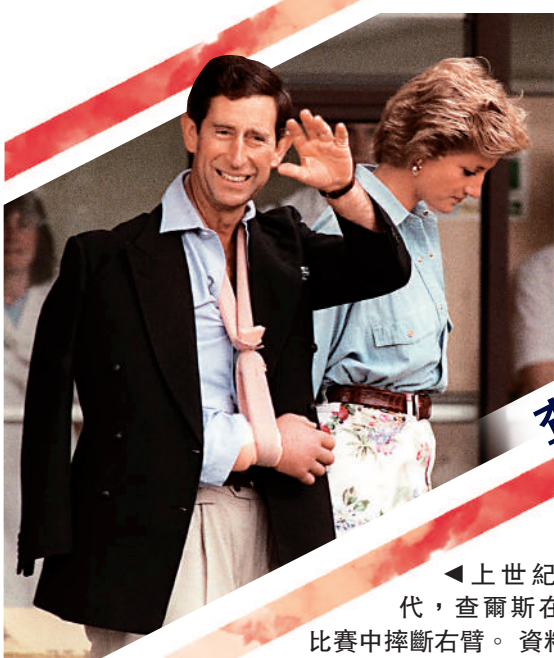
▲上世紀90年代，查爾斯在馬球比賽中摔斷右臂。