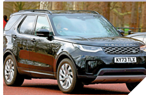
▲哈里王子乘坐的車輛6日駛向克拉倫斯宮。