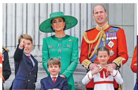
▲凱特王妃（後排右二）上月接受腹部手術，但王室並未公布其病情。

據報導，凱特的康復預計將持續至復活節假期之後。英媒稱，王儲威廉在妻子凱特完成手術後已重返崗位，但如今面臨妻子和父親同時生病的情況，承受着巨大壓力。弗格森近期披露，自己患有黑色素瘤，這是一種嚴重的皮膚癌。去年夏季，她還被診斷出患有乳腺癌，曾公開談論接受乳房切除手術和重建手術的決定。