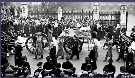
▲喬治六世的葬禮於1952年2月15日舉行。

英國癌症研究中心警告說，到2040年，英國每年將新增50萬宗癌症病例。肺癌同樣是對英國人威脅最大的癌症之一。在33個財富和收入水平相當的國家和地區中，英國肺癌5年存活率排名第28位，約為20%。查爾斯的外祖父、英女王伊麗莎白二世的父親喬治六世正是因罹患肺癌，於1952年去世。BBC稱，喬治六世患癌的原因是第二次世界大戰期間承受了巨大精神壓力，以及長期吸煙。