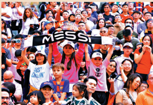
▲四萬球迷滿懷希望入場觀看球王美斯表演，最後卻失望而回。

警務處處長蕭澤頤表示，截至昨日中午，警方收到6宗相關報案，已經轉介海關進一步跟進。