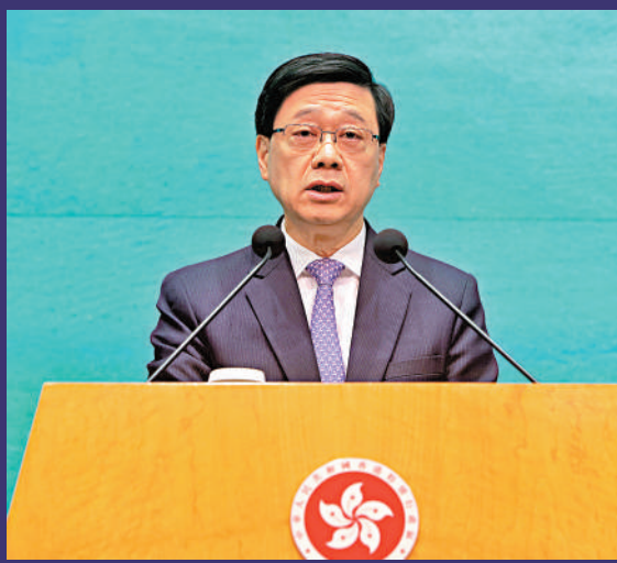
▲李家超表示，已即時要求文體旅局等部門檢視是次做法，以及日後協助舉辦大型活動的監督角色、責任和要求。