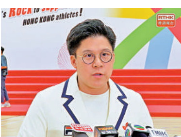
▲霍啟剛要求主辦單位給球迷、遊客及香港市民一個合情合理的交代。

霍啟剛希望主辦單位「可以考慮一個合適的方案，給球迷、遊客及香港市民一個合情合理的交代，展示一份應有的尊重。」他期望大家銘記這次的教訓，未來繼續以體育精神，把盛事舉辦得愈來愈好，回饋社會。