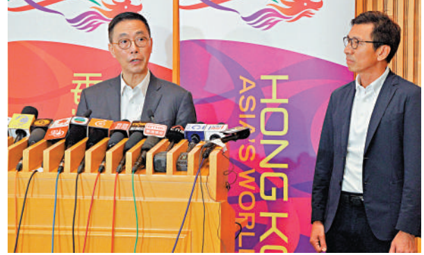
▲文化體育及旅遊局局長楊潤雄（左）早前表示，雖然主辦方Tatler Asia撤回申請政府M品牌1600萬元資助，但政府仍會根據法律展開調查。

至於今次事件會否影響本港將來舉辦類似大型體育活動盛事，鄭泳舜說仍有很多來自世界各地的機構、體育會等有興趣來港舉辦活動，相信今年仍有很多大型體育活動舉行。