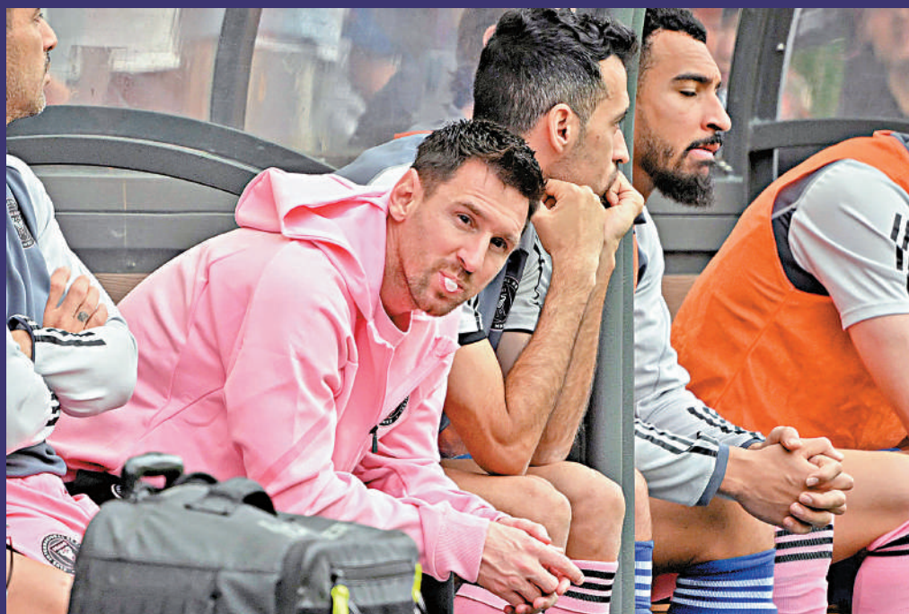
▲美職聯球隊國際邁亞密來港踢表演賽，但隊中的王牌，球王美斯卻因傷而沒有落場。