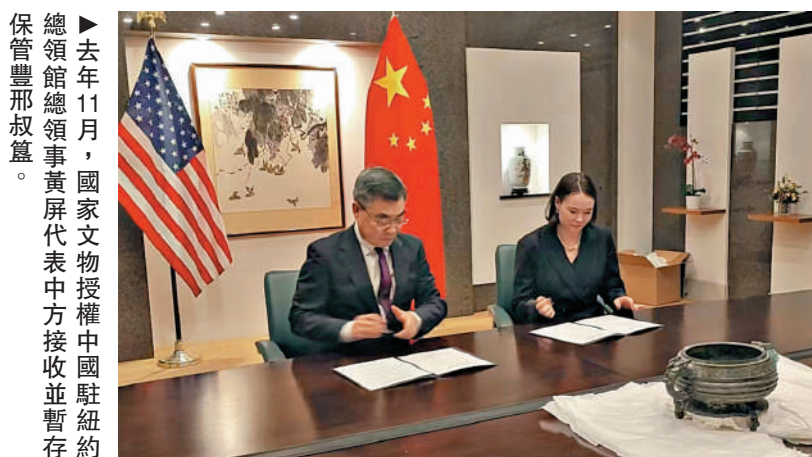
去年11月，國家文物局總領事黃屏代表中方接收並暫存保管豐邢叔簋。

據介紹，豐邢叔簋(粵音軌)於1978年在陝西省寶雞市扶風縣法門鎮一處西周晚期青銅器窖藏出土，通高18厘米，口徑21厘米，腹深12厘米，重6千克。腹鼓，斂口，上腹飾一周竊曲紋，腹下部飾瓦楞紋，圈足下接獸首三扁足，雙耳上端均飾卷鼻獸首，是典型的西周青銅器形制，具有簡潔而莊重的時代風格。此簋內底鑄有銘文3行18字(含重文2個)「豐邢叔作伯姬尊簋，其萬年子子孫孫永寶用」，書法藝術精湛。器物製作工藝反映了西周青銅器高超的鑄造水平。1984年11月被盜，流失海外。