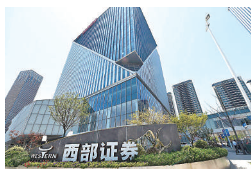
▲A股金融板塊昨表現強勢，西部證券一度漲停。

持續上漲，主要得益於政策面的積極信號，特別是中央匯金投資有限責任公司的增持，提振了投資者信心，也帶動了更多資金入市，有效阻斷了市場的負反饋機制。