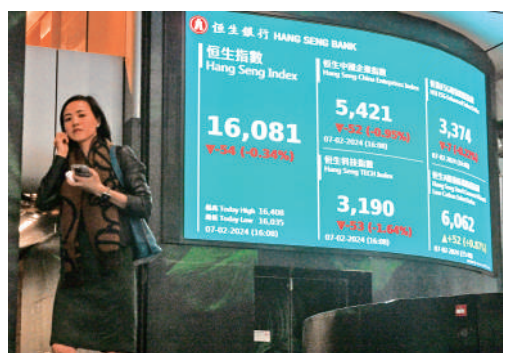
▲港股未能承接周二強勁反彈勢頭，投機盤見好即沽，指數昨倒跌54點。

中芯國際(00981)預期今季毛利率受壓，股價挫7.9%，收報14.12元。中芯國際上季度純利按年倒退54%，按季增長85%，公司預期今年首季毛利率會因折舊而受壓。華虹半導體(01347)股價跌11.4%至13.86元。華虹上季按年少賺77%，按季則升154%，大摩調低其目標價，由18元降至15.8元。百勝中國(09987)股價逆市升14.7%，收報332.8元；百勝上季多賺81%，全年純利升87%創新高，兼且計劃進行12.5億美元股份回購行動。