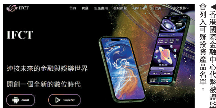
▲香港國際金融中心代幣被證監會列入可疑投資產品名單。

1月12日，證監會又警示公眾，提防由Eternity Prime Limited操作、名為「Eternity.inc forex packages」的可疑投資產品，產品與外匯投資有關，又聲稱能提供達36至84%的年度回報。證監會強調，公眾切忌盡信那些「好得令人難以置信」的投資機會。1月26日，證監會提醒公眾提防兩項分別名為Floki Staking Program及TokenFi Staking Program的可疑投資產品，產品與今次的「香港國際金融中心代幣」一樣同屬數碼代幣。