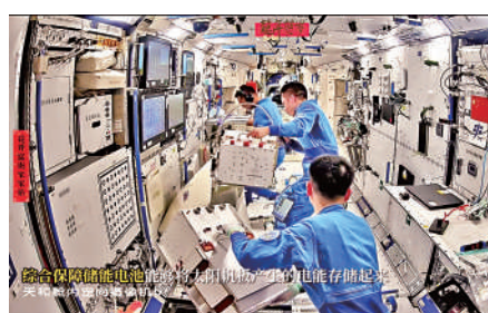
▲神十七號乘組近日仍忙於安裝天舟七號送來的各類應用實（試）驗裝置。

視頻顯示，航天员們更新的新細胞組織實驗模塊實驗組件，不僅能夠自動調控組件內環境，還能通過顯微成像、光譜檢測等方式記錄細胞組織的日常影響、實驗資料等。固液介觀反應裝置，則可以通過螺旋輸送機向反應釜投放固體及液體物料。