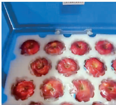
▲生果是「龍年盲盒」內藏的物資之一。