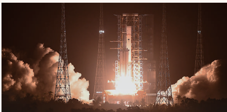
▲上月升空的天舟七號為神十七號乘組送去「龍年盲盒」。

2月3日小年夜，神舟十七號指令長湯洪波透過湖南衛視太空來信，給大家拜早年；同日在澳門大三巴牌坊前舉行的「歡樂春節」啟動儀式的現場，神舟十七號乘組與可愛的中國龍玩偶通過視頻致以春節問候。