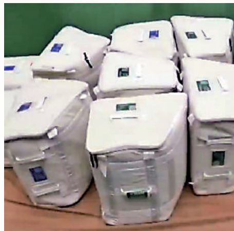
▲「龍年盲盒」裝載的除了食物外還有各類物資。