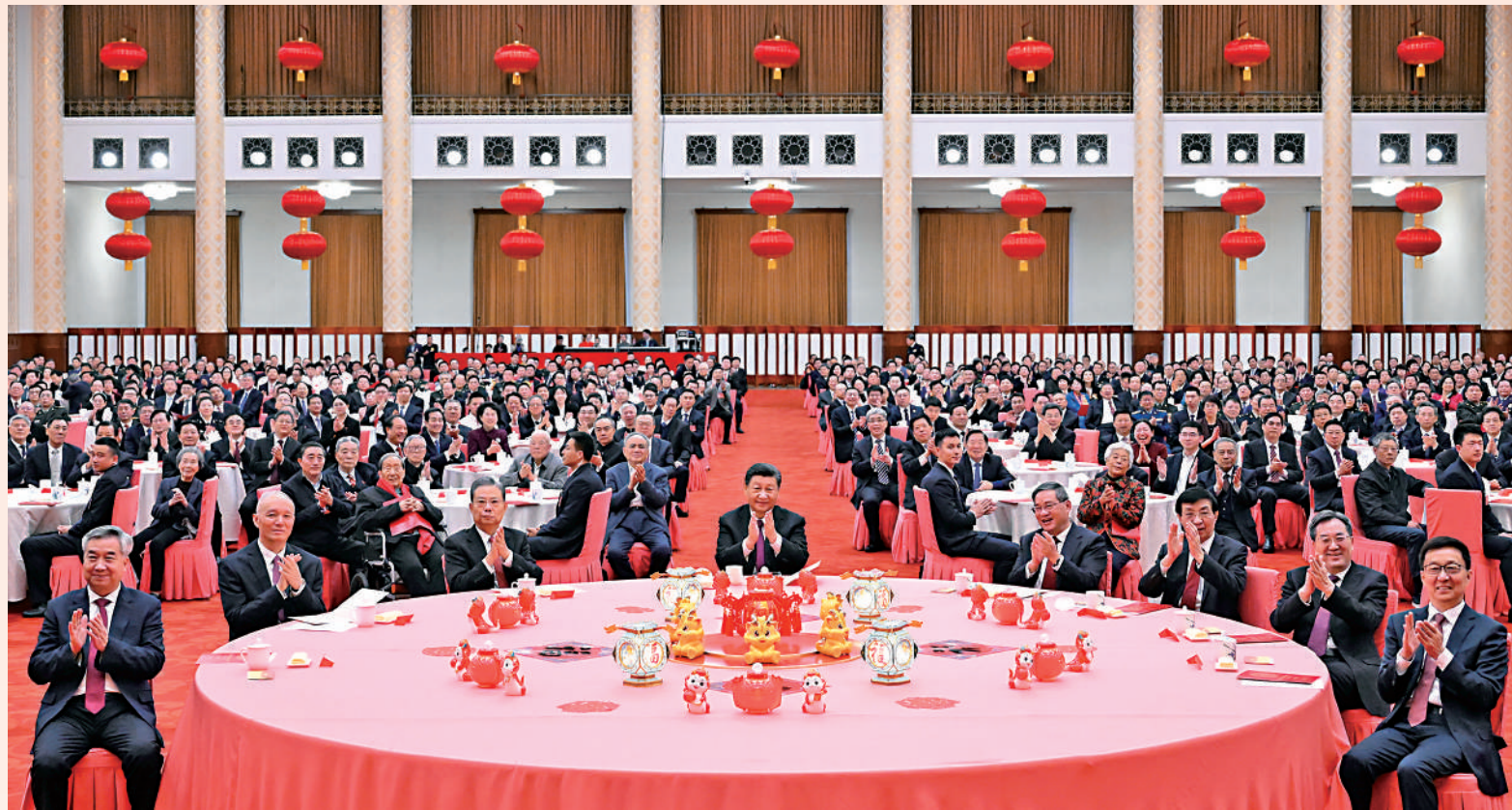
▲2月8日，在2024年春節團拜會上，中共中央總書記、國家主席、中央軍委主席習近平發表講話。