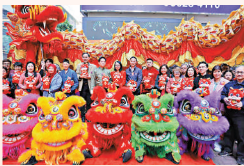
▲銅鑼灣街頭舉行「龍騰虎躍賀新春」活動，與市民歡度佳節。

另外，在年初一，灣仔各界協會、灣仔友好協會、灣仔社團活動中心及灣仔區慈善敬老會，在銅鑼灣街頭舉行「龍騰虎躍賀新春」活動，與市民歡度佳節。