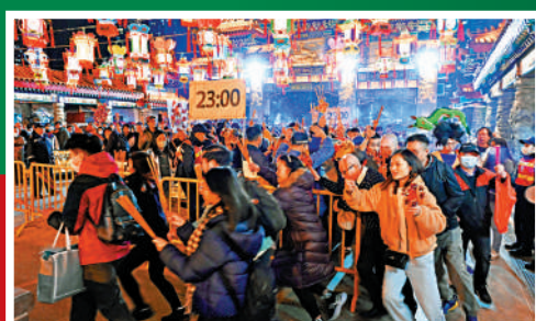
▲大批善信在年三十晚到黃大仙祠上「頭炷香」。

另外，全港十五個年宵市場在歲晚一連七日舉行，共錄得約200萬人次到訪。其中，維園年宵市場在年三十當日，錄得超過20萬人次到訪。年宵市場結束後，食環署收集由花槽檔主自願送贈未售出的花卉和盆栽，轉贈予223間安老院或殘疾人士院舍和兩間公立醫院。