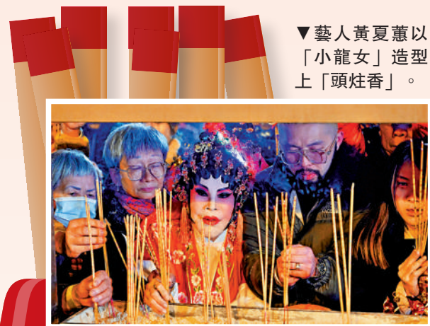
▼藝人黃夏蕙以「小龍女」造型上「頭炷香」。