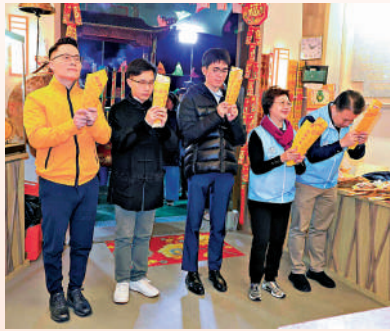
▲主禮嘉賓到三角天后廟上「頭炷香」，祈求香港繁榮安定。