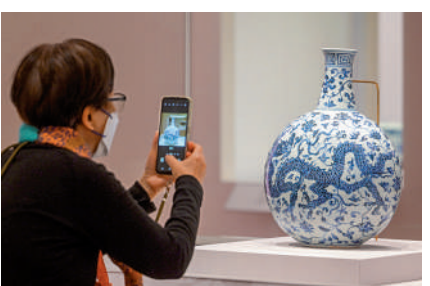
甲辰龍年，香港故宮文化博物館展出8組「龍」文物，吸引許多遊客參觀。

作的愛好者，到香港故宮自然少不了看看英國國家美術館的珍藏品。「只是15分鐘高鐵，就能在香港看到拉斐爾、提香、莫奈、梵高等50位藝術家的世界名作，真的是一件超值的事