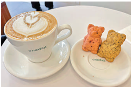
香港大坑有着不同風格的咖啡館，吸引內地客慕名而來。

拍照打卡。「一個小小的街區，藏着非常多的出片點！知名的有潮人打卡熱點勵德邨、百年古廟蓮花宮、古蹟虎豹別墅等。不然隨便找一個咖啡店，一個設