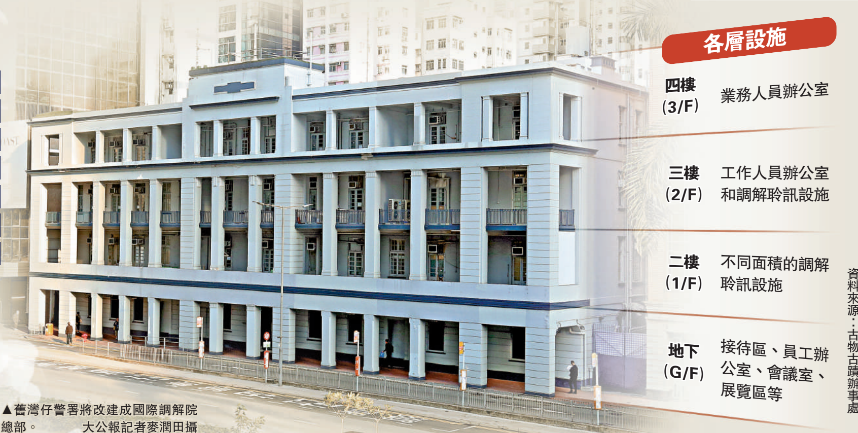
▲舊灣仔警署將改建成國際調解院總部。