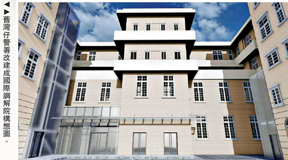
▲舊灣仔警署改建成國際調解院構想圖。