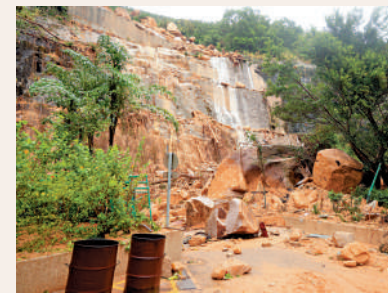
▲去年9月8日香港遭遇破紀錄暴雨，筲箕灣耀興道發生山泥傾瀉，封鎖了往返耀興邨的道路。

同樣遭受山泥傾瀉影響、出現路陷的石澳道，路政署已聯同土力工程處，為全面恢復兩線行車制訂方案，目前已大致完成在路邊加裝31支迷你樁，鞏固斜坡，同時減少臨時斜坡的傾斜度，提高安全性，預計本月下旬可以重開兩線行車。