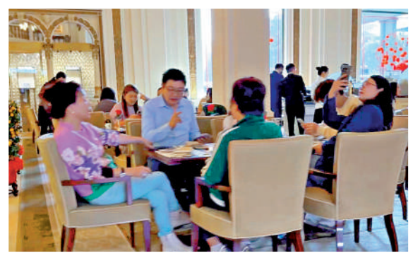
▲半島酒店咖啡廳昨日下午茶時間座無虛席，還要排隊等候。