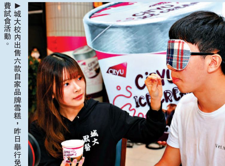
►城大校內出售六款自家品牌雪糕，昨日舉行免費試食活動。