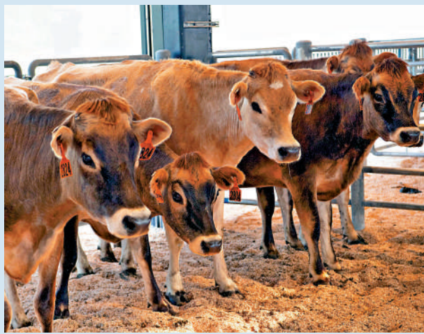
▲城大位於大埔林村的農場於前年十一月啟用，支援獸醫課程，並生產乳製品。

香港城市大學推出自家品牌雪糕，合共六款口味，昨日起於校內開售。用於製作雪糕的牛奶，來自大埔林村的自設農場，該農場在2022年11月中投入使用，用於六年制獸醫醫學課程的教學支援用途，校方經過兩年研製，成功將農場生產的乳製品製作成牛奶及雪糕，促進動物醫學、健康一體化。