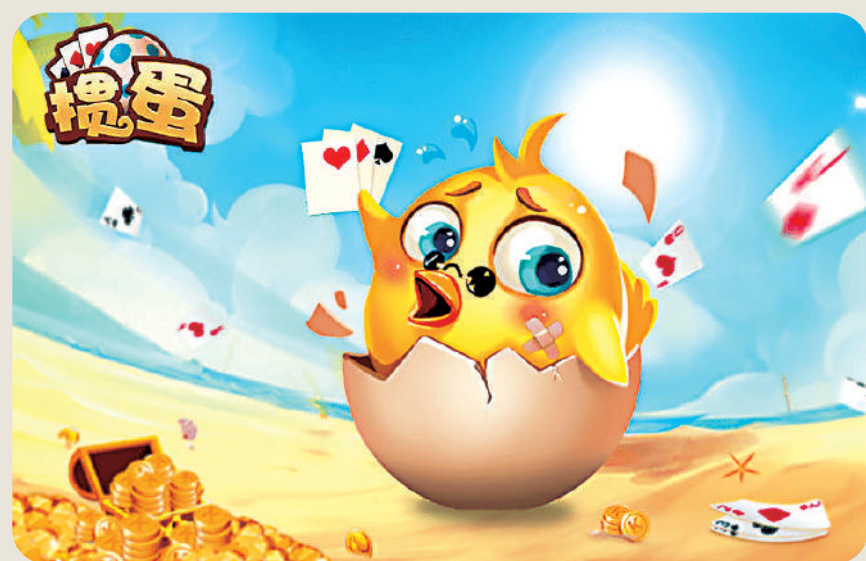
▲攞蛋最初流行於江蘇及安徽兩省。