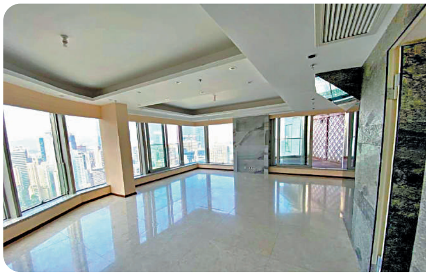
君珀頂層複式銀主盤的大廳面積寬敞。

消息指出，銀行為免囤貨，早於農曆新春前調整多項物業叫價，上述君珀頂層複式單位於年廿八左右，再劈價逾千萬，成功以7225萬元沽出，比1年前拍賣價大減約18%，折合實用呎價30205元。翻查資料，此單位原由一名內地客持有，早於2012年11月斥資1.51億元向發展商購入，當年呎價逾6萬元，惟數年前疑因資金周轉困難，淪為銀主盤，現以7225萬元沽出，物業賬面貶值7875萬元，12年跌價52%，暫屬今年貶值金額及幅度最大的銀主盤。