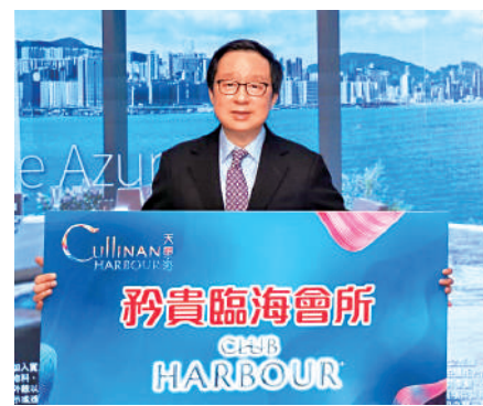
▲雷霆稱，天璽·海樓書下周出爐。

導，近期有行家有大量成交，眾所周知香港億萬富豪數目在世界前列，即使經過幾年疫情，港人存款額仍然持