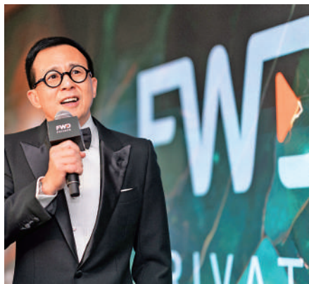
▲市傳李澤楷旗下富衛集團尋覓新投資者，為第四度在港集資上市作好準備。

【大公報訊】富衛集團於去年3月第三度向聯交所遞交主板上市申請，但因市況波動再度擱置。富衛集團上市計劃多次受阻之後，外電引述消息人士指出，電盈(00008)主席李澤楷