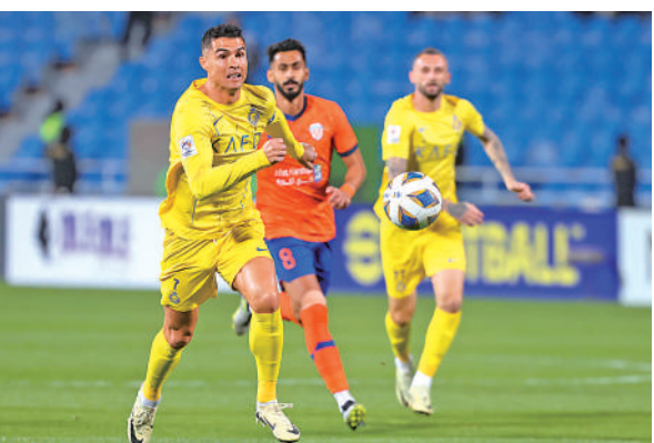
▲C朗(左)在亞冠盃對艾費哈取得入球。

【大公報訊】據每日郵報報導：葡萄牙球星C朗拿度繼續創造紀錄，於周三亞冠16強首回合代表艾納斯上陣，這是他球會生涯第1000場賽事，在這場里程碑之戰中，C朗更是於比賽末段取得全場唯一入球，帶領球隊作客以1:0險勝另一支沙特阿拉伯球隊艾費