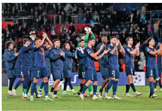
▶聖門贏球賽後球員慶祝。

今仗麥巴比不僅帶領聖日耳門取得優勢，更成為主角，他入球後，於職業生涯踢68場歐聯取得44個入球，超越皇家馬德里名宿魯爾，成為歐聯史上入球第2多的25歲球員，美斯則以25歲時取得59球排第1。麥巴比同時於今季各項賽事上陣30場創造38個入球(31個入球及7次助攻)，是今季歐洲5大聯賽創造最多入球的球員。