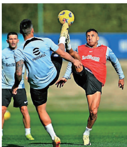
▲國米狀態佳今年賽事全勝。圖為球員備戰對沙蘭力坦拿。網絡圖片

這是C朗在2024年的第一個入球，這個入球令他得以自2002年起，連續23年都有入球，為他第1000場賽事添上特別意義，C朗賽後說：「我今季仍會繼續保持出色水平，很希望能帶領艾納斯贏得更多冠軍，我與隊友非常團結，這是我們贏球的秘訣。」