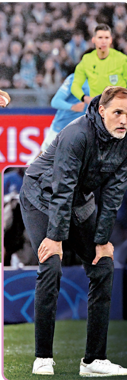
▲拜仁慕尼黑主帥杜切爾。