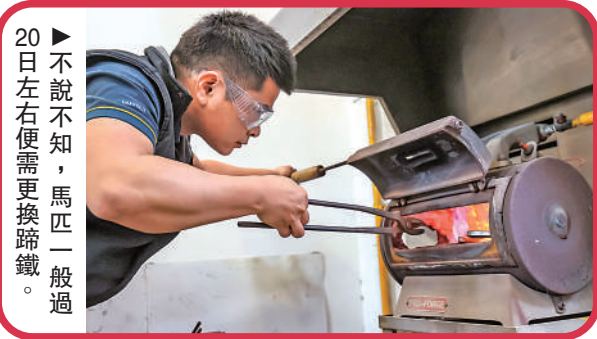
▶不說不知，馬匹一般過20日左右便需更換蹄鐵。