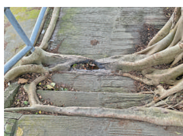
▲西區域多利道沙灣消防局對面一條通往沙灣徑的樓梯，有一梯級因樹幹阻礙而剩得19厘米闊。