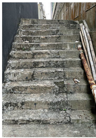
▲▼筲箕灣東大街17號旁巷仔一條11級的樓梯日久失修，梯級邊緣已損毀，高低不平。