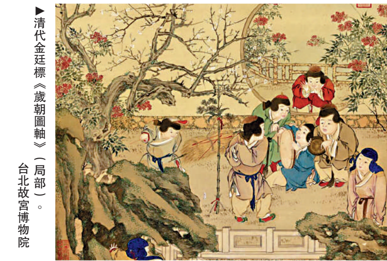
▲清代金廷標《歲朝圖軸》(局部)。台北故宮博物院

漢代「過年」的文化內容已頗為豐富，人們在家裏祭祀祖先、禮敬尊長，走出家門拜謁宗親鄉黨，還要觀測風向、雲、雨等自然現象，預測一年的收成。漢代人過年大餐中有一道特殊的菜餚，這就是兔子的骸骨，據說此物能給人帶來幸運。今天的人可能對「吃兔免」感到傷感，而古代的「暗黑年俗」還不止於此。魏晉南北朝時期流行正月初一打糞堆，人們以一串銅錢繫於竹杖腳下，旋轉着拋到糞堆上，以求新年諸事順利。隋朝時北方習俗正月十五打糞堆，有人還假裝疼痛答應。