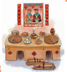
▲祭灶王是廣泛流行的年俗。