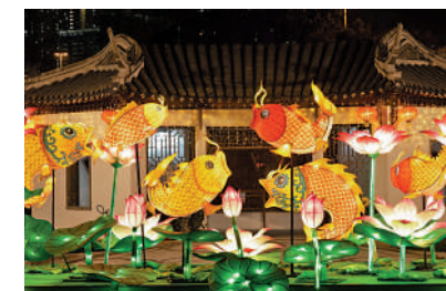
▲元宵燈彩展氛圍濃。

在網絡化的今天，春節有了許多新過法，傳統春節的時空顯著擴大，但其蘊含的文化傳統仍需進一步發掘，正如書中所言春節「在當代社會生活中映射出異樣的光芒，對於我們來說，它是光明而溫暖的」。