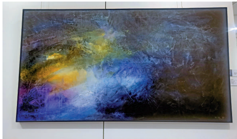
▲黃約翰作品《班特阿齊海上歷險記》。