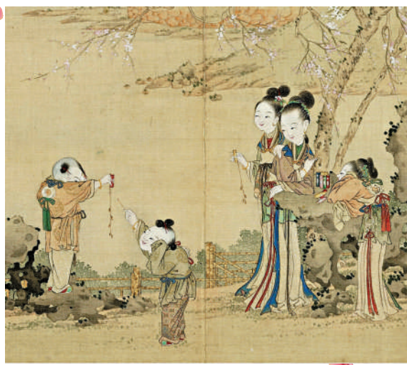
▲清代《升平樂事圖冊·放鞭炮》。台北故宮博物院

書中指出，臘八食粥的文化內涵其實更加豐富，中國古代就有冬至以赤豆粥祭神的習俗，臘八在冬至之後，將冬至粥移到臘八十分自然；而民間的一些臘八粥傳說則體現了勤儉節約的觀念，還有傳說臘八粥來自於宋元璋當皇帝前將乞討來的各色米豆合煮食用。從歷史來看，隋唐文獻幾乎找不到臘八粥的記載，宋朝之後卻屢見史籍，可見當時已經流行。在《武林舊事》《酌中志》《宛署雜記》等古籍中還記錄了臘八粥的不同配方，不同的食料都有美好的寓意，桂圓象徵富貴團圓，百合象徵百事和睦，紅棗花生象徵早生貴子，核桃象徵和和美，等等。湖北英山的臘八粥還加入肉片，河北遵化、陝西洋縣等地則有用臘八粥塗抹、澆喂果樹以祈豐茂多實，真可謂別具一格。