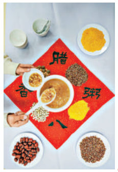
▲農曆臘月初八是中國傳統的「臘八節」，人們有在這一天的「喝臘八粥」的習俗。

再如，臘八粥的來歷有種種傳說，影響最大的是紀念佛祖成道以及牧羊女獻粥之恩，故又名「佛粥」。