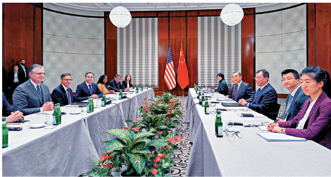
▲當地時間2月16日，中共中央政治局委員、外交部長王毅在出席慕安會期間與美國國務卿布林肯會晤。

發言人指出，中法同為聯合國安理會常任理事國和獨立自主大國。今年是中法建交60周年。不久前，習近平主席同馬克龍總統互致賀電並發表視頻致辭，強調雙方要共同努力，將面向下一個60年的中法全面戰略夥伴關係打造得更加牢固和富有活力。王毅外長此次訪法，是今年中法首場重要訪問。王毅外長將同法方舉行雙邊會見，並同法國總統外事顧問博納舉行新一輪中法戰略對話。中方期待同法方一道，進一步深化戰略溝通，鞏固政治互信，擴大務實合作和人文交流，加強多邊議題上的溝通協作，共同引領中歐關係行穩致遠，並為世界和平、穩定與發展進步作出積極貢獻。