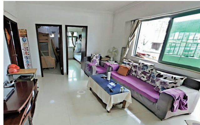
德福花園戶型選擇多，適合各類買家需要。