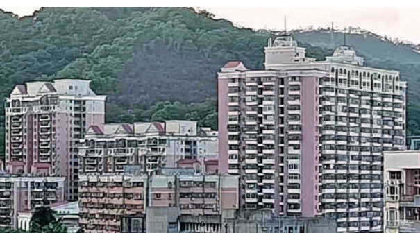
德福花園於1997年起陸續開發，合共建25幢住宅。