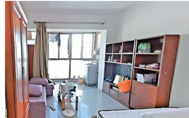
寶麗苑共351伙，間隔介乎一房至四房。