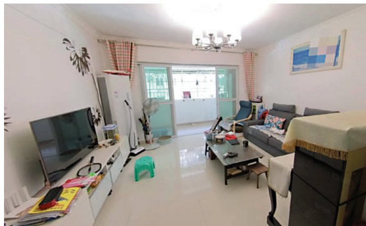
榮超花園主力戶型為兩房及三房。