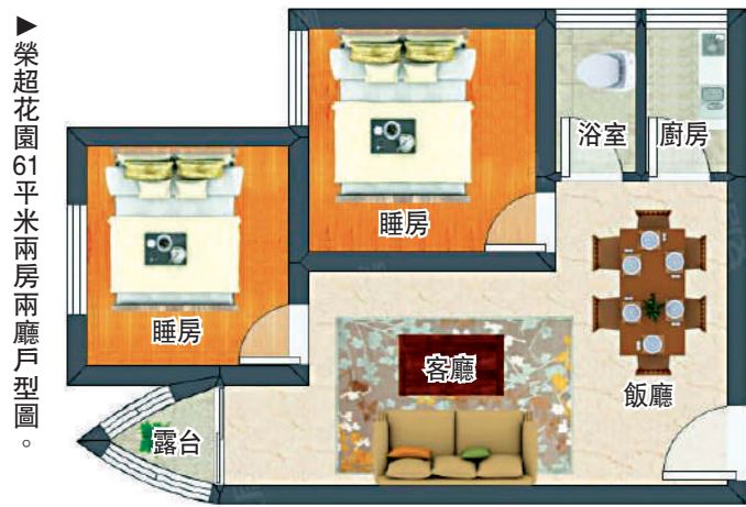
榮超花園61平方米兩房兩廳戶型圖。