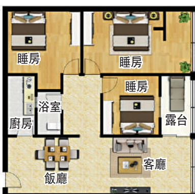
德福花園71平方米三房兩廳戶型圖。

教育方面，小區有德福幼兒園、德興小學和布吉中學。對外交通便利，附近有多條公交通線，鄰近有清平高速，駕車前往羅湖和龍崗快捷。地鐵方面，乘坐公交通車站可到5號線長龍站，一站到深圳東站和布吉地鐵站，可坐火車和地鐵前往全國和深圳各區。商業方面，小區有家和樂超市、錢大媽和百果園等。醫療有德興社區診所和藥店。