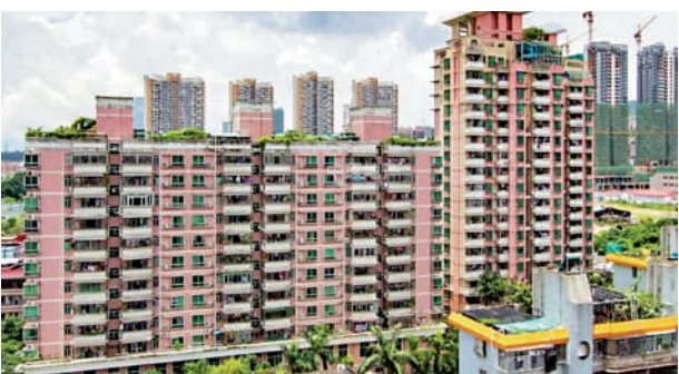
粵寶花園分為多層和小高層住宅，提供801個單位。