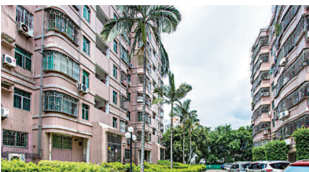
寶麗苑共三座，屋苑設有保安，管理完善。