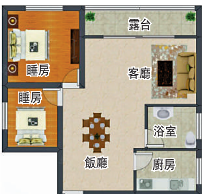
粵寶花園62平方米兩房兩廳戶型圖。

周邊教育配套完善，有粵寶花園幼兒園、德興小學、春蕾小學、布吉中學、百合中學等，滿足全方位學習需要。商業配套齊全，周邊大小超市林立，餐飲有肯德基、麥當勞、各式酒樓食肆等。醫療方面有布吉人民醫院、武警醫院、德興社康站。