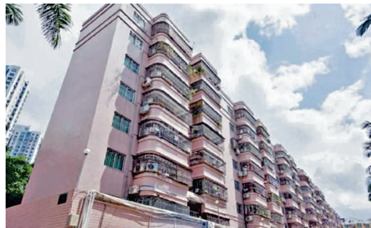
榮超花園由22幢住宅組成。