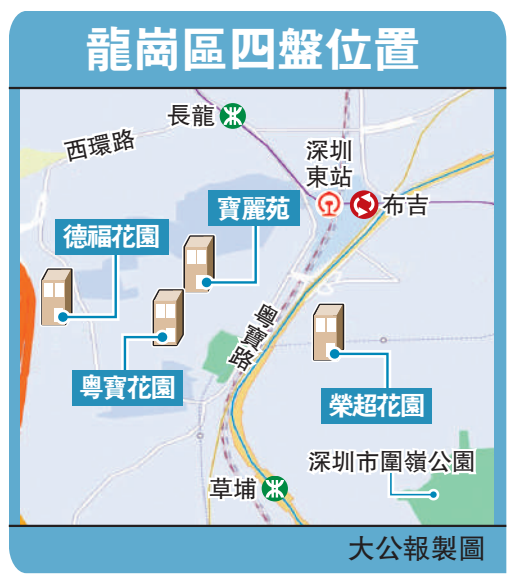
龍崗區四盤位置 大公報製圖

布吉新城作為布吉街道城市更新的重要項目，目前正在有序推進，該項目位於布吉老街片區，緊鄰深圳東站，東臨龍崗大道，南臨西環路，西臨清平高速，北臨西環路，面積約360公頃，擬拆除範圍約144公頃，範圍內現狀總建築面積約366萬平方米，主要以居住、商業為主。被納入更新範圍的布吉一村、布吉新三村、壹村東心嶺、錢排村和桑達寶電工業區等社區將加速迎來「舊貌換新顏」的機會。