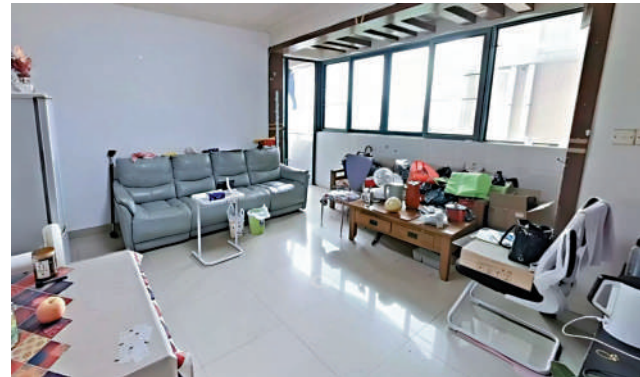
粵寶花園管理費約每平米0.8元人民幣。

屋苑配套齊全，購物有華潤超市、永豐百貨、肉菜市場；教育有春蕾小學及百合外國語學校。交通優勢則更明顯，地處龍崗大道，有多條公交線路，坐公交一站到深圳東站和布吉地鐵站，可以乘坐列車和地鐵線，到達全國各地和深圳全市。