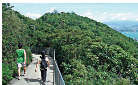
▲龍虎山山頂和克頓道。

龍虎山高253米，是龍虎山郊野公園的所在地。香港大學的本部建築群座落於龍虎山東北部山腳。面積只有47公頃的龍虎山郊野公園，雖是全港最小的郊野公園，卻擁有鬱蔥的林地、綠樹成蔭的歷史徑、草地野餐區，以及數百種鳥類和蝴蝶的棲息地。