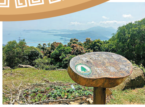
▲石龍拱位於元荃古道上。

石龍拱位於大嶼郊野公園內，元荃古道郊遊徑上，海拔475米。元荃古道郊遊徑是昔日連接荃灣和元朗兩地的貿易路徑。這條古老山徑兩旁樹木叢生，全長約12.5公里，沿途可俯瞰荃灣及青衣一帶景觀，於石龍拱山頂可以飽覽大帽山、荃灣、汀九橋及青馬大橋的景色。