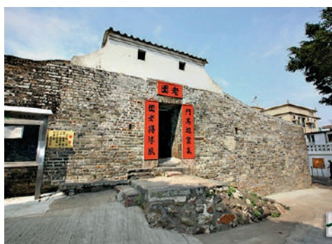
▲老圍門樓是龍躍頭文物徑上的古蹟之一。

龍落水不算山，而是東平洲一條長長的灰白色岩層，自山腰延伸入水，岩石邊緣呈三角狀，外形猶如神龍蜿蜒下海，因而得「龍落水」之名。東平洲屬香港聯合國教科文組織世界地質公園範圍，龍落水排列有致的岩層，猶如精準的雕刻，不同角度岩石的顏色和層次也會有所不同，景觀千變萬化。