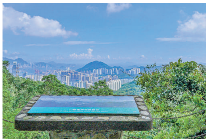
◀川龍家樂徑觀景台。