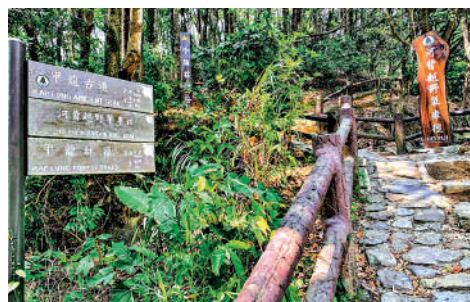
▲甲龍林徑初段與甲龍古道重疊。

甲龍林徑位於大帽山西面山坡，初段與甲龍古道重疊，後者是香港一條歷史悠久的古道，為古時八鄉石崗一帶務農人士往來荃灣的必經之路。整段郊遊徑都在林間，沿途有不少楠樹紅葉、吊鐘花、宮粉羊蹄甲、木棉及象牙花等植物可供欣賞。