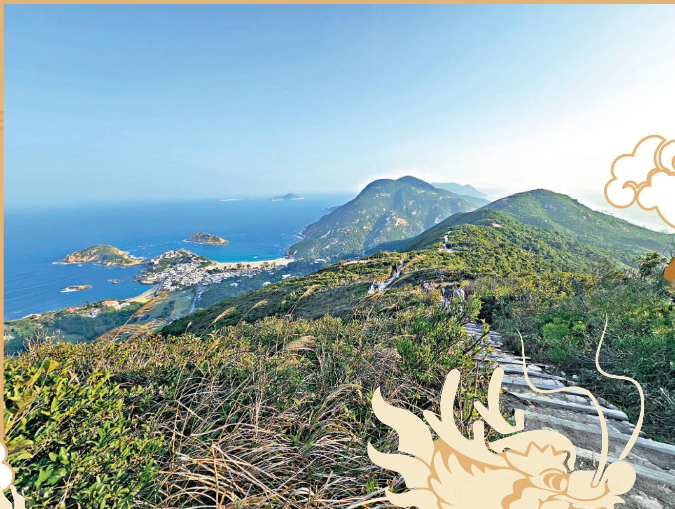
◀山脊隨山巒高低起伏，如龍伏其上，脊骨蜿蜒。