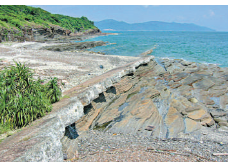
▲龍落水灰白色岩層奇特，是東平洲最著名的景點之一。