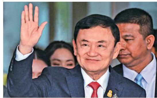
▶泰國前總理他信獲假釋並於18日出獄。圖為他信於去年8月22日回國時向外界致意。