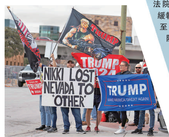
▲共和黨總統參選人黑利16日在得州拉票期間，特朗普的支持者在場外高呼口號。

另外，在上月26日，特朗普因誹謗女作家卡羅爾，收到賠償8330萬美元（約6.5億港元）的罰單。法庭可能會在上訴期間，要求特朗普預先存入罰金。目前不清楚特朗普還有多少現金，他在去年作證時表示，手上有約4億美元現金（約31.2億港元），《福布斯》估計他淨資產為26億美元（約202.8億港元）。除了多宗民事案件被判罰款外，特朗普還在四宗刑事案件中被起訴91項罪名。