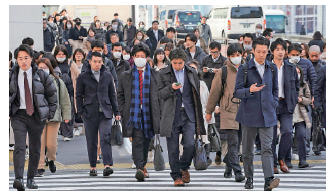
▲日本打工仔今年加薪幅度有望為30年最大。

據日本民間智庫日本經濟研究中心對37名經濟學家的調查統計，預計今年日本大企業向工會提議的加薪幅度平均為3.85%，(包括底薪增加2.15%，以及依年資自動加薪1.7%)，為1990年代初期資產泡沫破滅以來的最大增幅，亦超越去年創下的30年最高增幅3.6%。