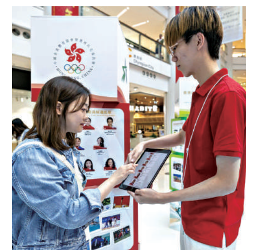
▲香港傑出運動員選舉正接受公眾投票。

香港傑出運動員選舉在4月24日於灣仔會展舉行頒獎禮，屆時會頒發香港傑出男運動員（5位）、香港傑出女運動員（5位）、香港最佳運動隊伍（1隊）、香港最佳運動組合（3組），大會亦會公布最佳男運動員及最佳女運動員得主。