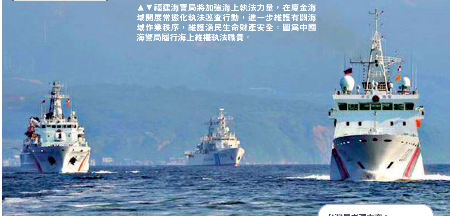
▲福建海警局將加強海上執法力量，在廈金海域開展常態化執法巡查行動，進一步維護有關海域作業秩序，維護漁民生命財產安全。圖為中國海警局履行海上維權執法職責。