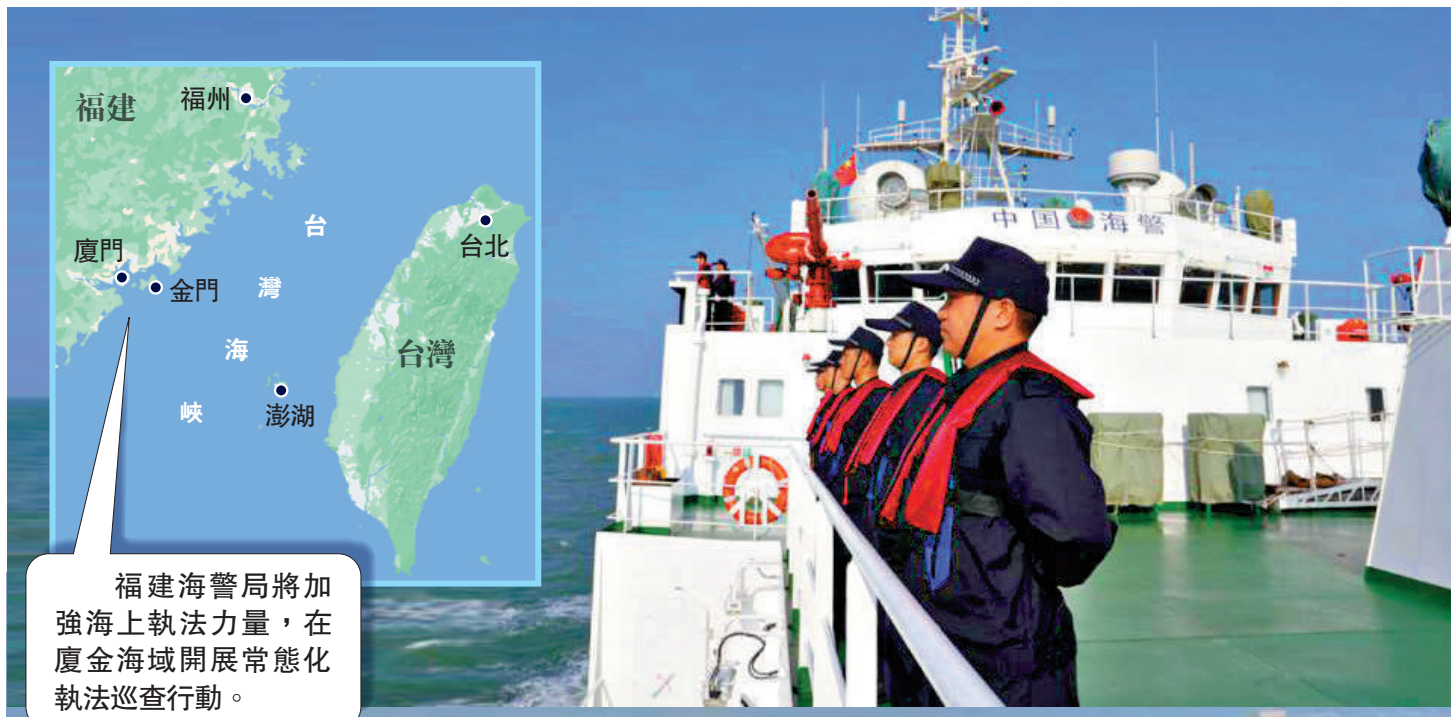
福建海警局將加強海上執法力量，在廈金海域開展常態化執法巡查行動。