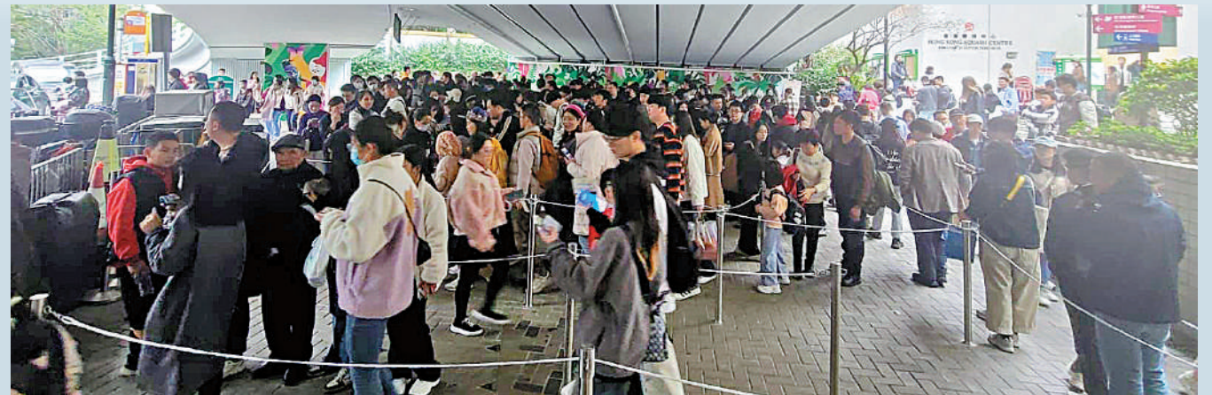
▶假日期間，中環山頂纜車站市民和旅客常大排長龍，「黑的」車隊趁機割客。

《大公報》調查發現，活躍於中環纜車站及山頂「黑的」車隊屬集團式經營，疑受黑幫操控，他們專割遊客，上山頂索價500元，比正常車資多逾五倍。有立法會議員憂慮「黑的」團夥有組織地經營，同行會在其他繁忙地段有樣學樣。議員建議除了加強執法外，建議政府年內強制所有的士安裝監控，有助收集證據檢控。