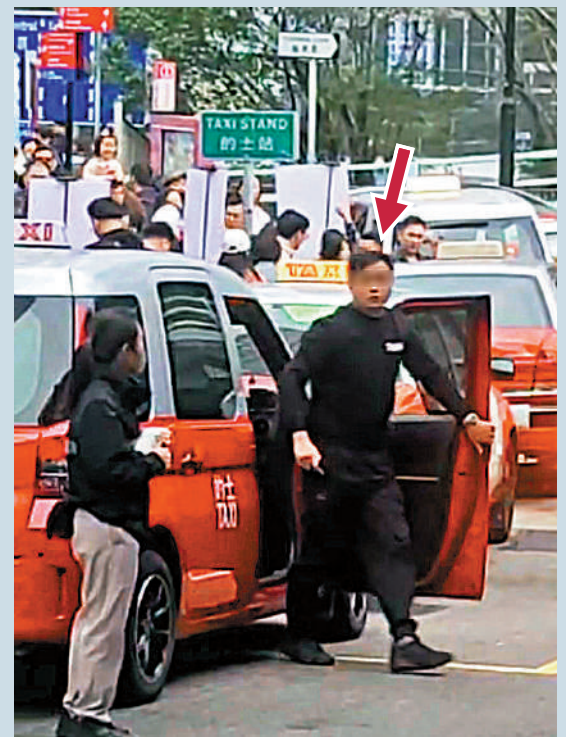
▶「黑的」車隊頭目「白鯨」（箭嘴示）在的士站頭指揮同夥司機。