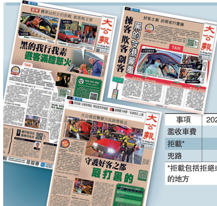
▶《大公報》早前系列報導「黑的」割客惡行，引起社會廣泛關注。