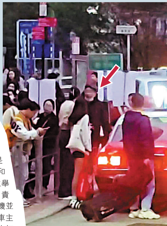
▶「黑的」車隊頭目「傻峰」（箭嘴示）安排旅客登上不同的士。

警方多次展開執法打擊的士違規行動，今年至今進行了四次執法行動，在尖沙咀及中區派警員「放蛇」及設置路障執法，至今共發出41張告票及拘捕4名司機，涉及拒載、濫收車資、圍旗載客等違規行為。