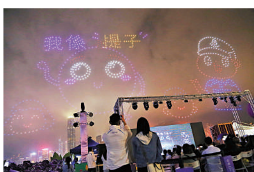
▲1200架無人機上演歷時12分鐘的「提子幼兒繪本天空秀」。

「提子海陸空大匯演」活動有歌手藝員夥拍「提子」唱歌、玩遊戲及作魔術表演，維港上空上演由1200架無人機呈獻歷時12分鐘的「提子幼兒繪本天空秀」。「提子親子嘉年華」活動期間，多件各款造型的「提子藝術裝置展品」遍布草地上，發放防騙資訊。