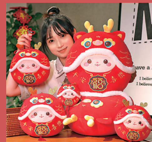
▲團圓福龍造型可愛寓意吉祥。

「國潮澎湃，年貨市場龍氣十足。」在接受記者採訪時，西安高校學者黨輝表示，「國潮」年貨的持續走熱和火爆出圈，不僅彰顯了當下中國春節新風尚，成為老百姓置辦年貨時不可或缺的一部分。同時，這些蘊含着傳統文化、美好寓意的年貨，也為春節賦予了更多人情味，承載着大家對家人的愛和對未來生活的憧憬。