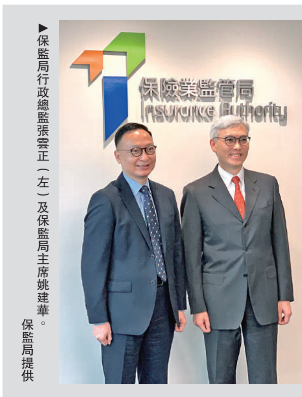
保監局行政總監張雲正（左）及保監局主席姚建華。

至於保監局未來發展，姚建華表示，未來保監局要做好三方面工作，一是加強與國家金融監管總局的溝通，與香港保險業界更多北上考察；二是近日中東方面亦十分活躍，希望結合「一帶一路」的發展，加強與這些國家合作；三是推動總部經濟，吸引內地保險公司來港成立區域總部，以方便其發展國際業務。