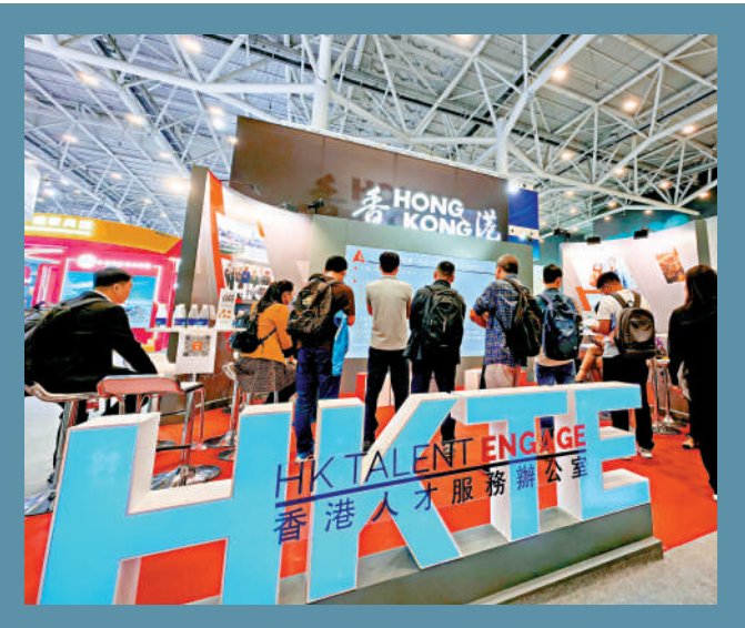
▲香港人才服務辦公室為來港人才提供各種支援。