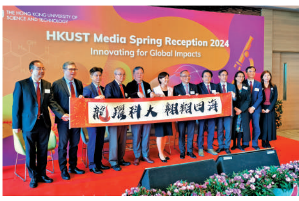
▲科大昨舉行春茗，交代籌建醫學院進度。

此外，籌備委員會諮詢政府、商界、撥款機構、醫療衛生界和教育界等相關持份者，就招生、課程、招聘教學