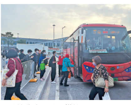
▲跨境學童排隊乘搭巴士。

App和微信公眾號等線上服務平台，家長可以通過這些平台實時查詢巴士的運行情況、購票、預約座位等，大大提升了通學的便利性。