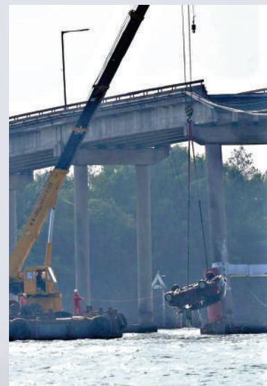
▲墜河車輛被打撈上岸。