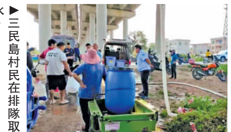
▶三民島村民在排隊取水。