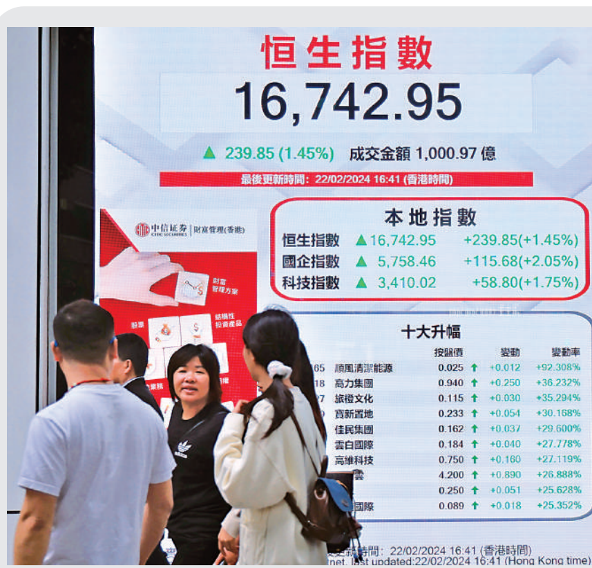
▲恒指昨日先跌後倒升239點，見1月2日以來收市高位。

中特估主題升勢欲罷不能，石油中海油(00883)股價破頂升5.8%，收報16.28元。煤炭股神華(01088)股價升5%，收報32.3元。電力股龍源電力(00916)升6.4%，收報5.46元。